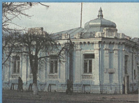
Муром. Вид из-за Оки Козьмодемьянская церковь Жилой дом XIX в. Дом Зворькиных