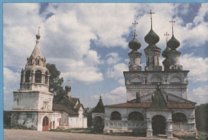
Благовещенский и Троицкий монастыри. XVI–XVII вв.