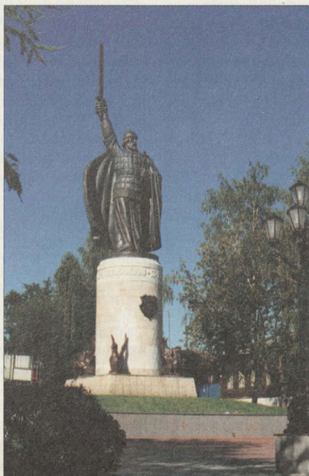
Монумент в память Ильи Муромца