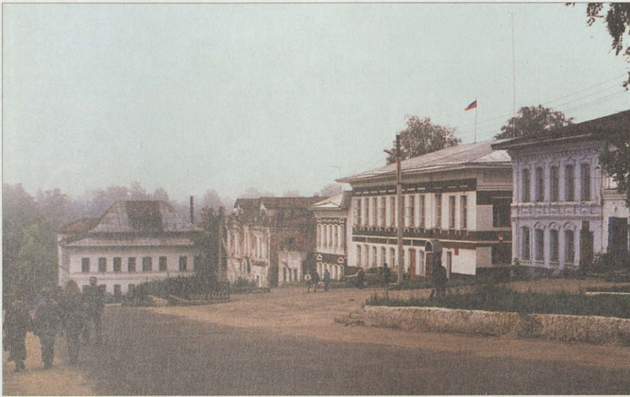
Меленки. Красноармейская улица.

ней части на голубом фоне — ветряная мельница.