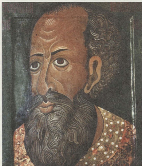
Иван Грозный. Копия с парсуны XVI в.

Время правления этих двух крупнейших государственных деятелей вошло в историю как время становления молодых европейских государств, в том числе и Российской державы, которая играла все более заметную роль в этих процессах. В водоворот бурных политических событий оказалась втянута и Александровская слобода. Василий III по примеру западноевропейских монархов решил построить «русский Версаль» и выбрал для этого Александровскую слободу. Очарованный красотой ее природы, богатством охотничьих угодий, близостью к духовной обители, месту своего крещения — Троице-Сергиевой лавре, великий московский князь направил в слободу лучших русских и итальянских мастеров, руками кото-