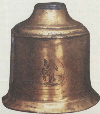
Поддон подсвечника с изображением опричника. XVII в.

Но славу древней Александровской слободы, которая и сегодня в исторической науке почитается как древняя столица России, не суждено было затмить никаким более поздним историческим событиям.