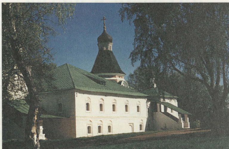
Покровская церковь. Домовый храм Ивана Грозного XVI в.

красоте и величию дворцово-храмовый ансамбль, который уступал своим великолепием лишь Московскому Кремлю. Светские и церковные постройки были украшены выдающимися образцами русской монументальной живописи — фресковыми росписями, изысканными резными белокаменными рельефами. В Александровской слободе была открыта первая в стране провинциальная печатня, где ученик Ивана Федорова — Андроник Тимофеевич Невежа — выпустил в 1577 году «Псалтырь Слободскую». В год празднования 480-летия Александровского кремля на территории музея-заповедника был установлен памятный знак, посвященный этому важному для России событию. При государевом дворе работала книгописная мастерская, где составлялся Лицевой летописный свод. Иван Грозный, будучи человеком просвещенным, имел одну из богатейших библиотек, основу которой составляли редчайшие книги, доставшиеся в наследство от Софьи Палеолог. Знаменитое собрание древних книг до сих пор не найдено. Многие склонны считать, что следы знаменитой либерии Грозного затерялись именно здесь.