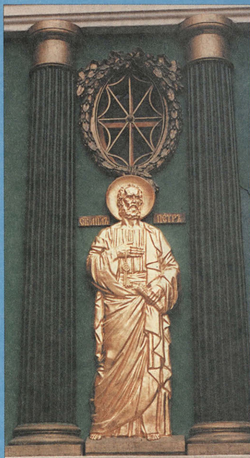
Апостол Петр. Фрагмент часовни Иверской Божией Матери

Возрожденные к новой жизни Собор Казанской Божией Матери и Иверские ворота