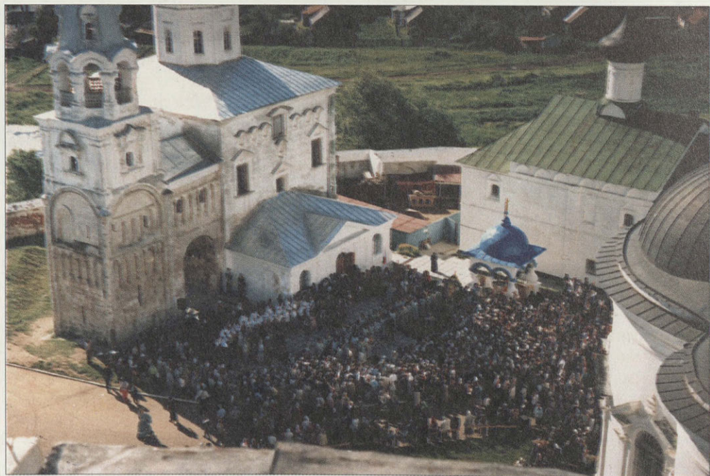
Боголюбово. В день светлого праздника Преображения Господня

Боголюбский замок был вторым после Владимира центром политической жизни времен Андрея Боголюбского. Сюда, в княжескую резиденцию, шли послы из соседних земель и зарубежья, здесь решались вопросы войны и мира и судьбы Владимирской земли и Руси.