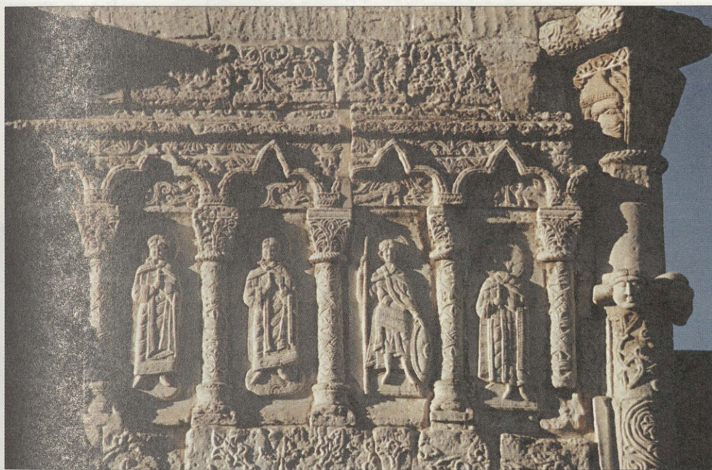
Георгиевский собор. XIII в. Фрагмент резьбы

местные купцы везут свои товары в Москву, Астрахань, Ригу, Ревель, на Макарьевскую и Ростовскую торговые ярмарки.