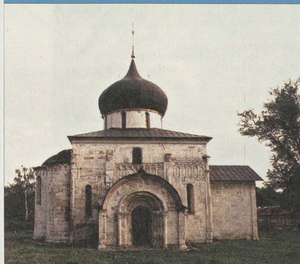
Юрьев-Польской — общий вид. Открытка. Конец XIX — начало XX в.