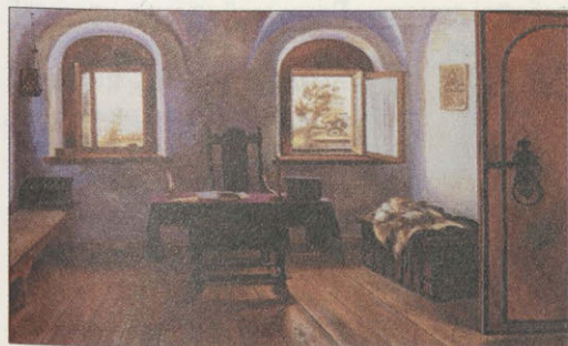
Вечерний звон. 1990