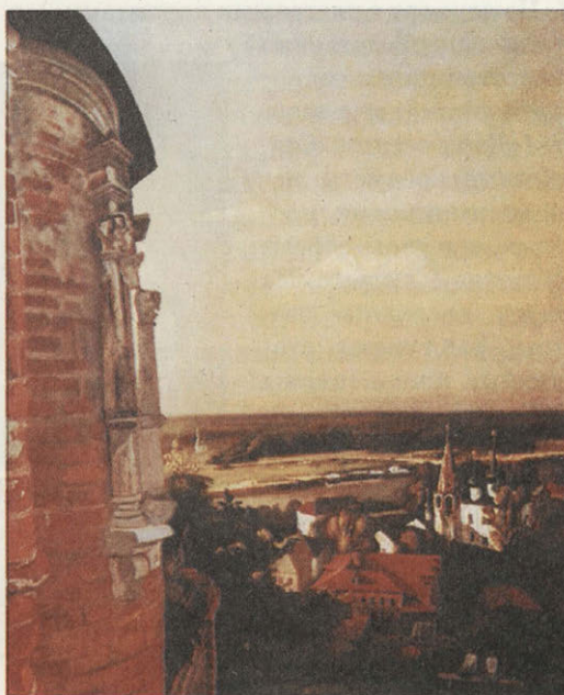
Вечер в Гороховце. Вид на Знаменскую церковь. 1990