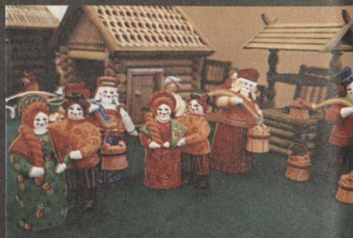
Ковровская глиняная игрушка