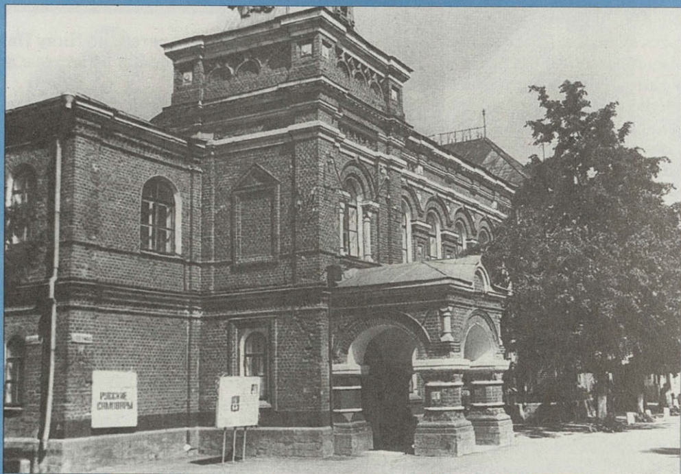
Здание земской управы. 1888. Ковров