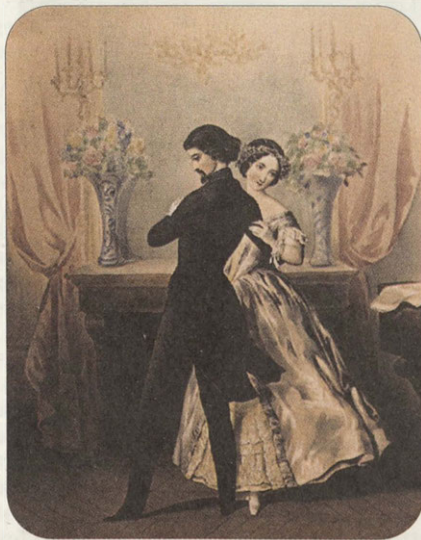
Лист из альбома «Танцы». Цветная литография. Издательство Тьерри-Феререс. Париж. Середина XIX в.

Молодой человек, решившийся приехать в дом к девушке, уже вос-