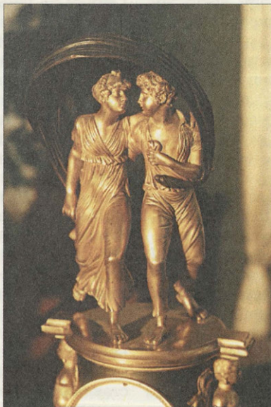
Парная скульптура. Навершие часов из экспозиции в доме Глинок. Западная Европа

Не за горами и 200-летие великого русского композитора, и ежегодное празднование должно стать всенародным.