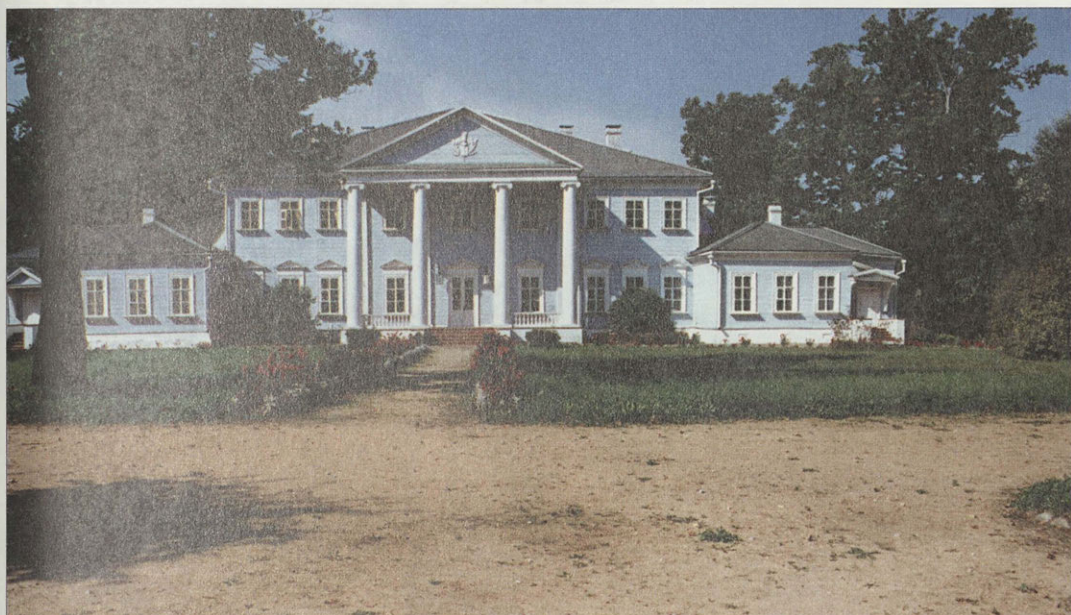
Новоспасское. Усадьба Глинок. Конец XVIII — начало XIX в. Ельнинский район Смоленской области