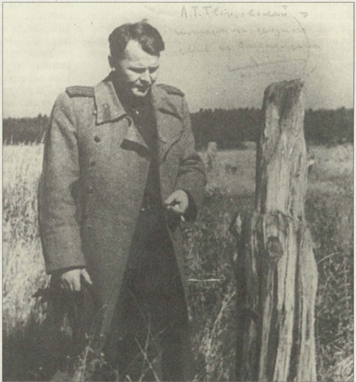
А. Т. Твардовский на пепелище родной усадьбы. 1943 г.