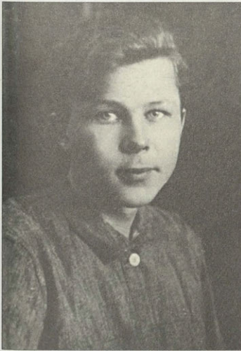
Александр Трифонович Твардовский. Фото. 1928–1929 гг.