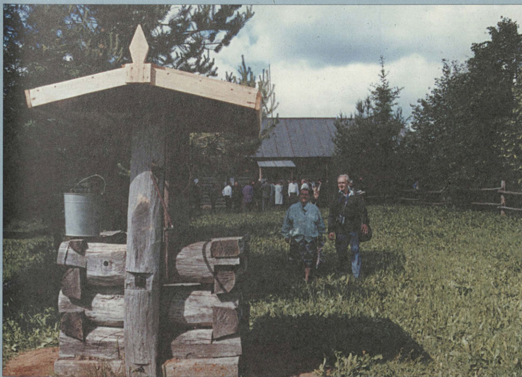
Колодец у дома Твардовских.