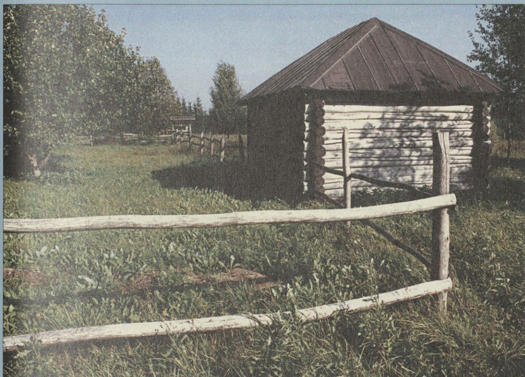
Банька и сад — «пять яблонь, пять сортов»

Памятный знак в виде большого камня установлен на месте родительского дома А. Т. Твардовского