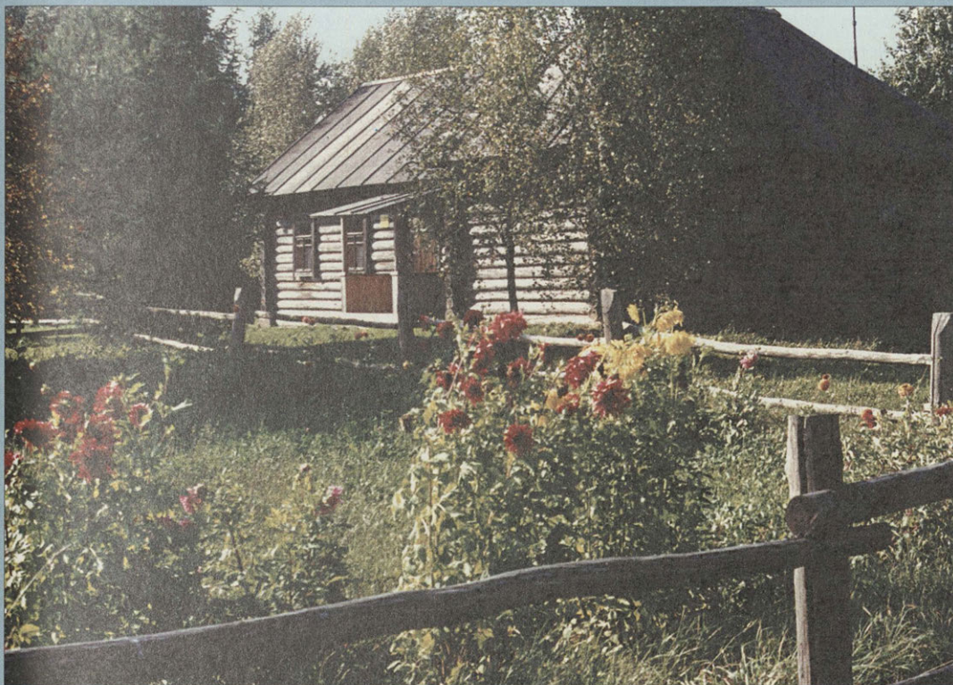
Дом Твардовских. Дом восстановлен братом поэта И. Т. Твардовским. В интерьере воспроизведена обстановка семьи Твардовских