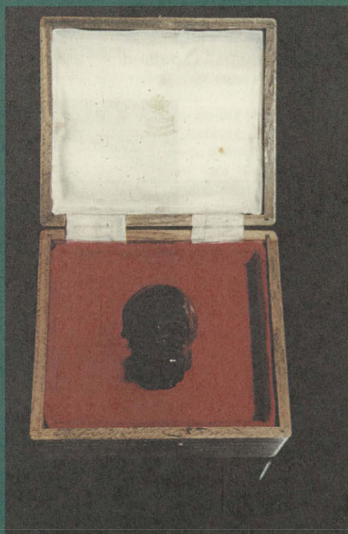
Бегемот. Конец XIX—начало XX в. С.-Петербург Фирма Фаберже. Первая публикация