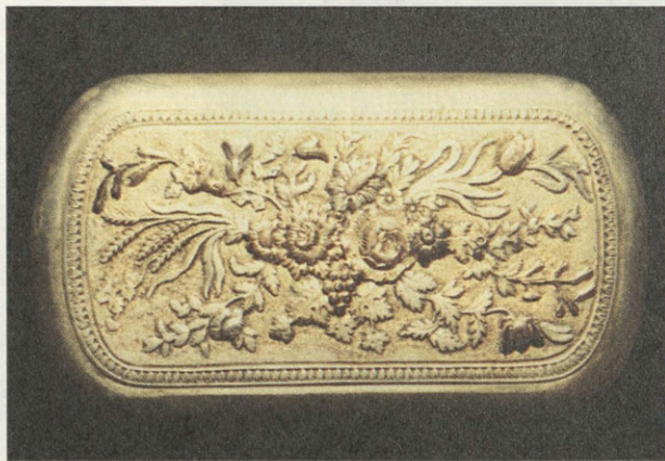
Портсигар. 1899–1903 гг. С-Петербург. Фирма Карла Фаберже. Мастер Федор Афанасьев (?). Первая публикация

Изделия, вышедшие из рук выдающихся мастеров, неизменно волнуют «прикосновением» к тайнам красоты.