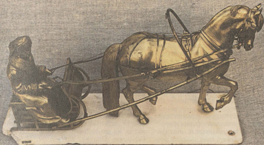
Скульптура каминная. Конец XIX в. Западная Европа. Золоченые фигурки коня и возничего в санях укреплены на мраморной подставке