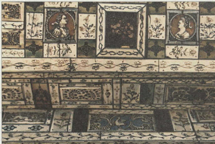
Фрагмент ларца. XVIII в.

В разделе современного декоративно-прикладного искусства художественное стекло особенно полно представлено продукцией местного Первомайского стекольного завода.