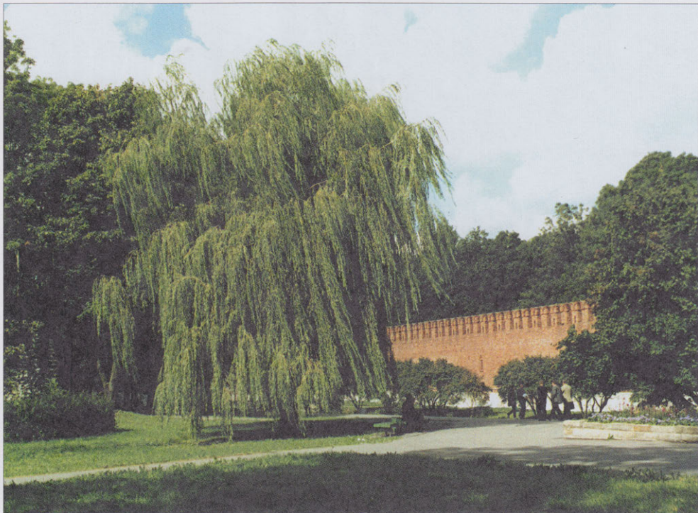
Старая ива у стены смоленской крепости

волны, накатываясь на вечно пограничный Смоленск, разбивались о его стены, оседая в виде польских кварталов, латышских улиц, татарских пригородов, немецких концов и еврейских слободок. И все это разноязыкое, разнобожье и разноукладное население лепилось подле крепости, возведенной Федором Конем еще при царе Борисе, и объединялось в единой формуле: ЖИТЕЛЬ ГОРОДА СМОЛЕНСКА . Здесь победители роднились с побежденными, а пленные находили утешение у вдов; здесь вчерашние господа превращались в сегодняшних слуг, чтобы завтра дружно и упорно отбиваться от общего врага; здесь был край Ойкумены Запада и начало ее для Востока; здесь искали убежища еретики всех религий, и сюда же стремились бедовые москвичи, тверяки и ярославцы, дабы избежать гнева сильных мира сего, и каждый тащил свои пожитки, если под пожитками понимать национальные обычаи, семейные традиции и фамильные привычки. И Смоленск был плотом, и я плыл на этом плоту среди пожитков моих разноплеменных земляков через собственное детство.