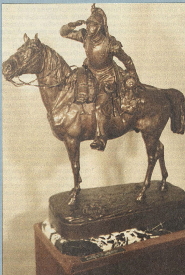
Кирасир на коне. XIX в. Г.Ж. Тома. Франция. Бронзовая скульптура, установленная на мраморной подставке