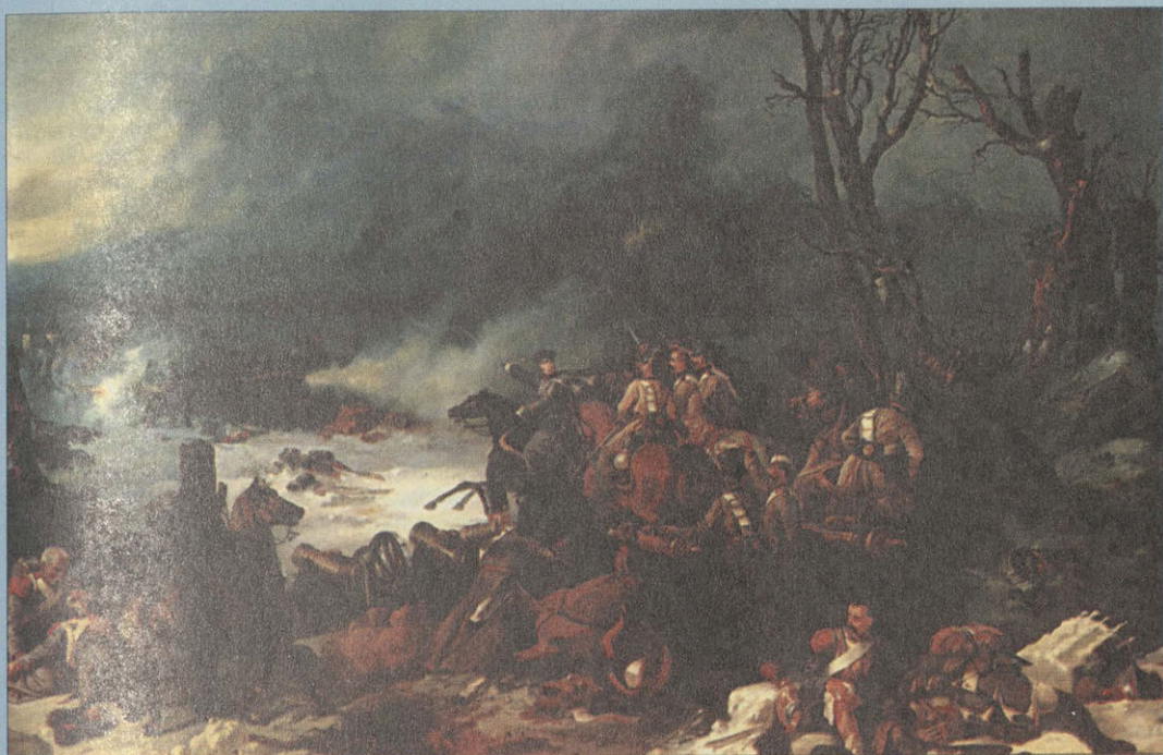
Подвиг батареи полковника Никитина в сражении под Красным. 1854 г. М. О. Микешин