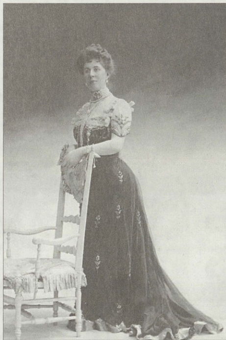
Княгиня Мария Клавдиевна Тенишева. Фото. Париж. 1902 г.