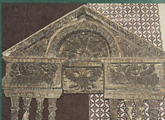
Возок. 1900-е гг. Изделие талашкинских художественных мастерских. По эскизу С. В. Малютина.