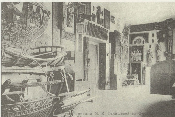
Историко-этнографический музей княгини М. К. Тенишевой. Фото. Начало XX в.

Многочисленные публикации посвящались собранию Тенишевского музея. Н. Тароватый в журнале «Искусство» отмечал, что коллекция резных и раскрашенных вещей из дерева заключала, кажется, все, «что возможно было собрать характерного в этом роде». Автор перечисляет также коллекции серебряных, цеканых изделий, кружек, братин, кубков, северных русских кружев, заключающих в себе очень редкие