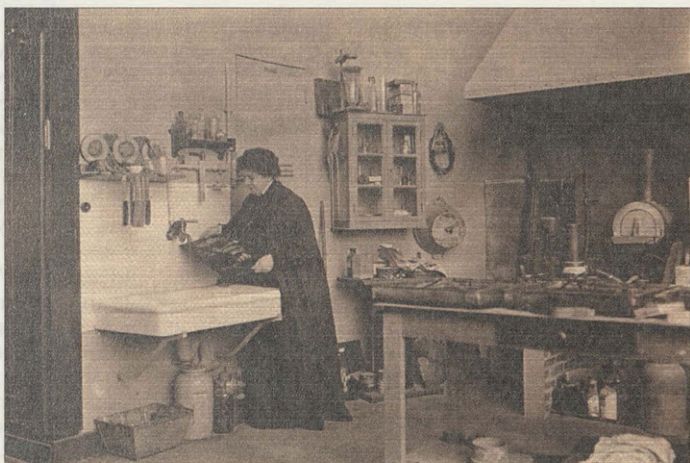
Княгиня М. К. Тенишева в Парижской мастерской. Фото. 1907 г.

образцы из золоченых и разноцветных шелковых нитей.