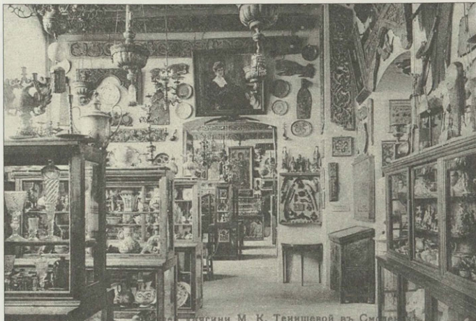
Историко-этнографический музей княгини М. К. Тенишевой. Фото. Начало XX в.

образованию Франции»), а Барщевскому был присужден орден «Palme academique» (пальмовая ветвь от Академии — отличительный знак университета, существующий с 17 мая 1898 года). Впервые в столь полном объеме состоялось знакомство европейской публики с русским народным и декоративным искусством.