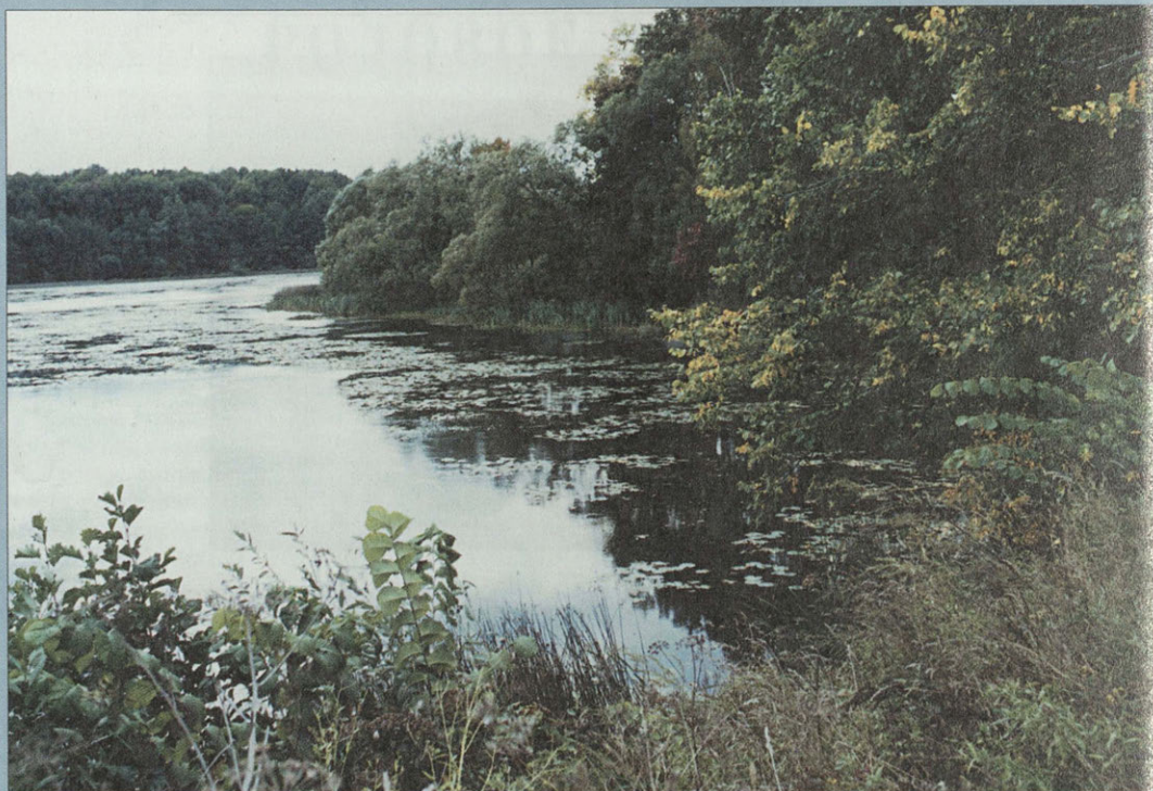
Нижний пруд в усадьбе Алексино