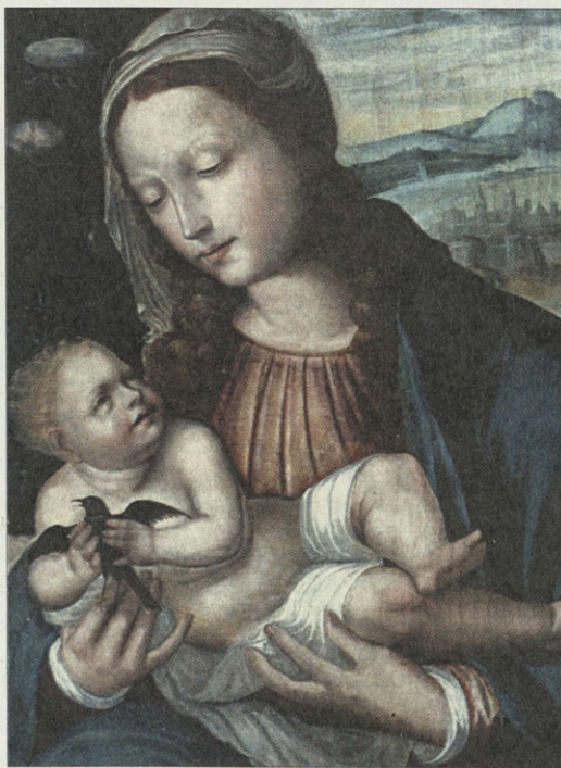
Мадонна со щегленком. XVI в. Нидерланды. Из коллекции Барышниковых

Трудно в полной мере оценить размеры и уровень барышниковского наследия. Слишком сложна судьба страны и людей, вовлеченных в водоворот ее истории. Но ясно одно: потомки обязаны быть благодарны семье Барышниковых за великий труд создания и хранения культурных ценностей.