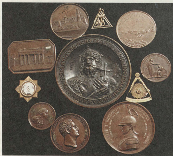
Медали, жетоны, знаки. Из собрания историко-археологического музея С. П. Писарева и В. И. Грачева

Первого музея Смоленска более не существует, но коллекции его сохранены во многом усердием преданных делу музейных работников. С трепетом раскрывая сегодня пакетики с монетами, с радостью обнаруживаем на пожелтевших листочках надписи, выполненные рукой В. И. Грачева, а на некоторых экспонатах полустертый шифр историко-археологического музея, жизнь которого сама стала предметом для исторических изысканий.