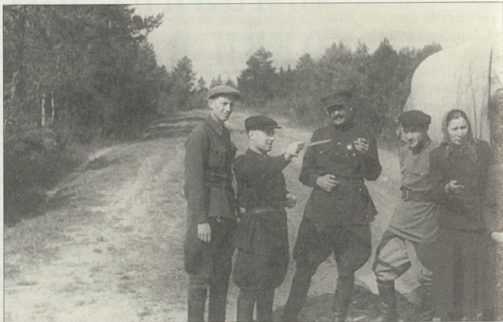
Экспедиция по местам боев 5-й Ворговской партизанской бригады Понятовка-Ершичи. Фото. 1947 г.