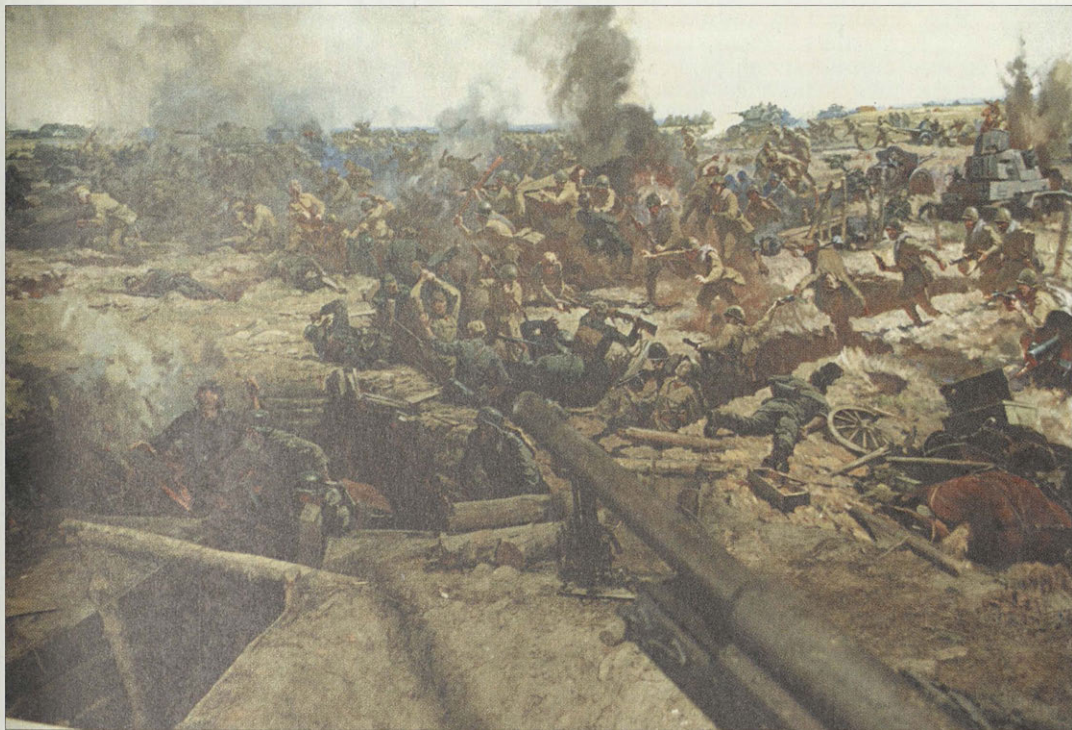
«Рождение Советской гвардии». Диорама. 1975 г. А. Н. Семенов. Художник студии Грекова. На диораме — эпизод наступления 4 роты 85 стрелкового полка 100 стрелковой дивизии И. И. Руссиянова в районе деревни Гурово под Ельней 5 сентября 1941 г.