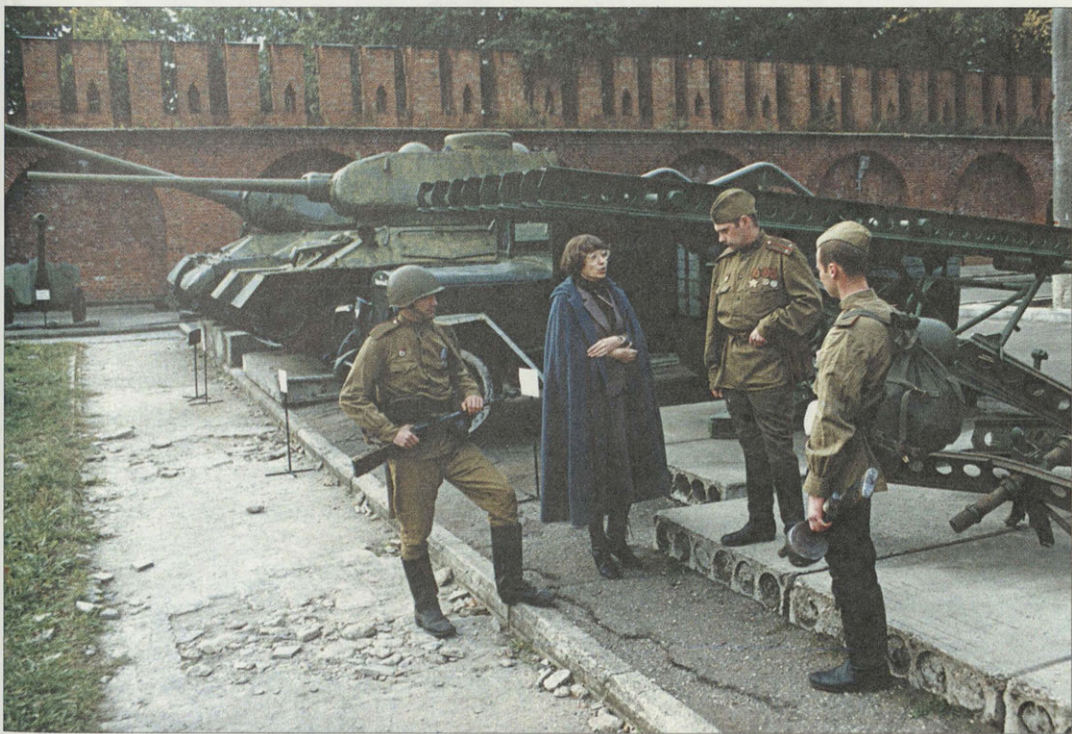
Члены военно-исторического клуба у экспозиции боевой техники периода Великой Отечественной Войны. Первой в ряду экспонатов установлена флеровская «Катюша»