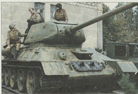
Танк Т-34 из экспозиции боевой техники периода Великой Отечественной войны

В музее установлен персональный компьютер с копией базы данных погибших. За счет поисковой работы сотрудников музея и ветеранов войны электронная версия «Книги памяти» Смоленской области постоянно пополняется. Новые сведения о местах и времени захоронения погибших они сверяют с имеющейся базой данных и, таким образом, уточняют и пополняют ее.