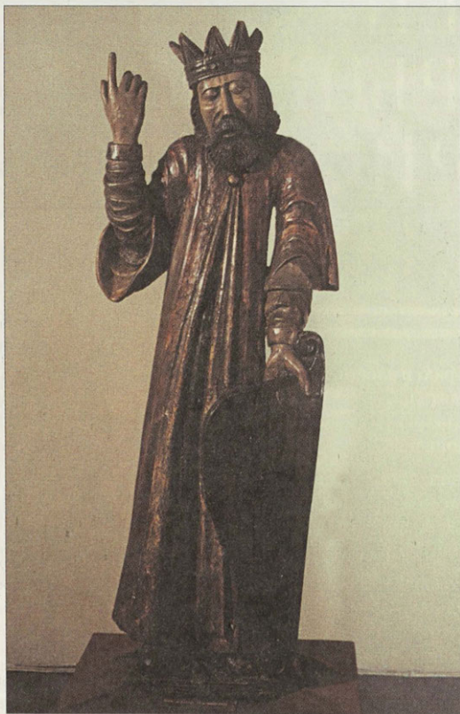
Давид Псалмопевец. Деревянная скульптура. Конец XVIII в.

Характерные признаки московского письма — плавное течение линий, гармоничность цвета, лаконичность композиции — заметны в иконе «Федор, Давид и Константин», на которой изображены