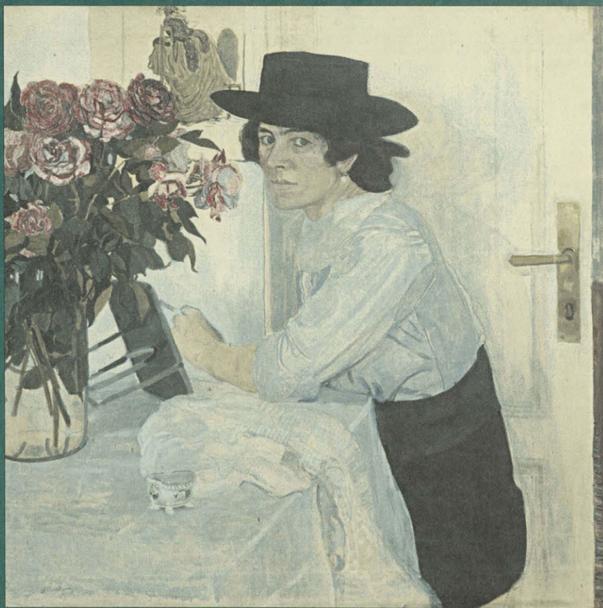
Портрет дамы. 1910-х гг. А. Я. Головин