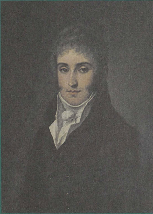
Портрет князя А. А. Чарторыжского. 1808 г. С. С. Шукин