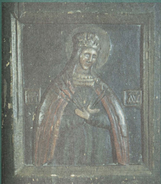
Богоматерь Семистрельная. Икона. Середина XIX в. Россия, Север