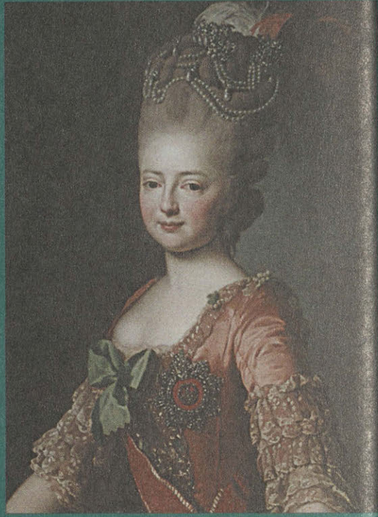
Портрет великой княгини Марии Федоровны. XVIII в. А. Рослин