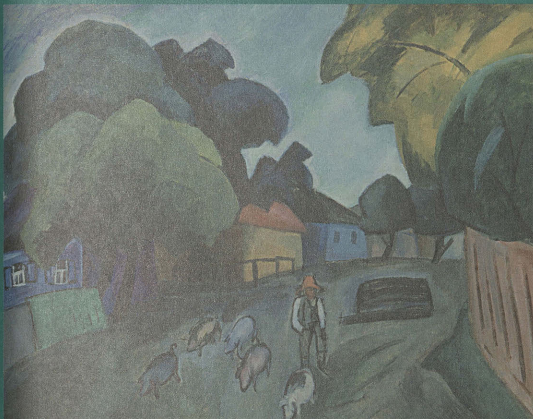
Пейзаж со свиньями. 1912 г. Р. Р. Фальк