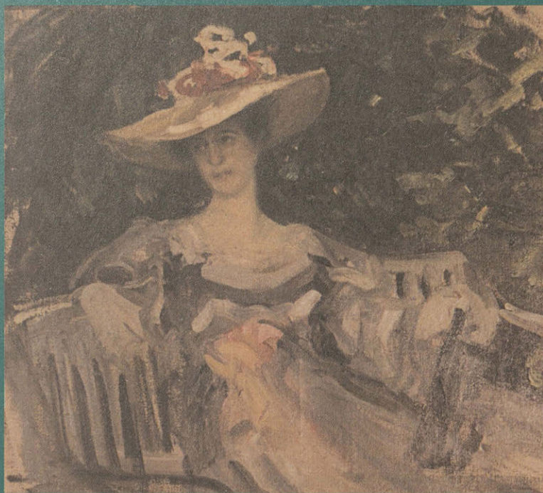
Портрет М. К. Тенишевой.