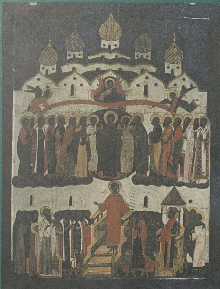
Покров Богоматери. Икона. Конец XVI в. Вологда. Икона из собрания Историко-этнографического музея княгини М. К. Тенишевой