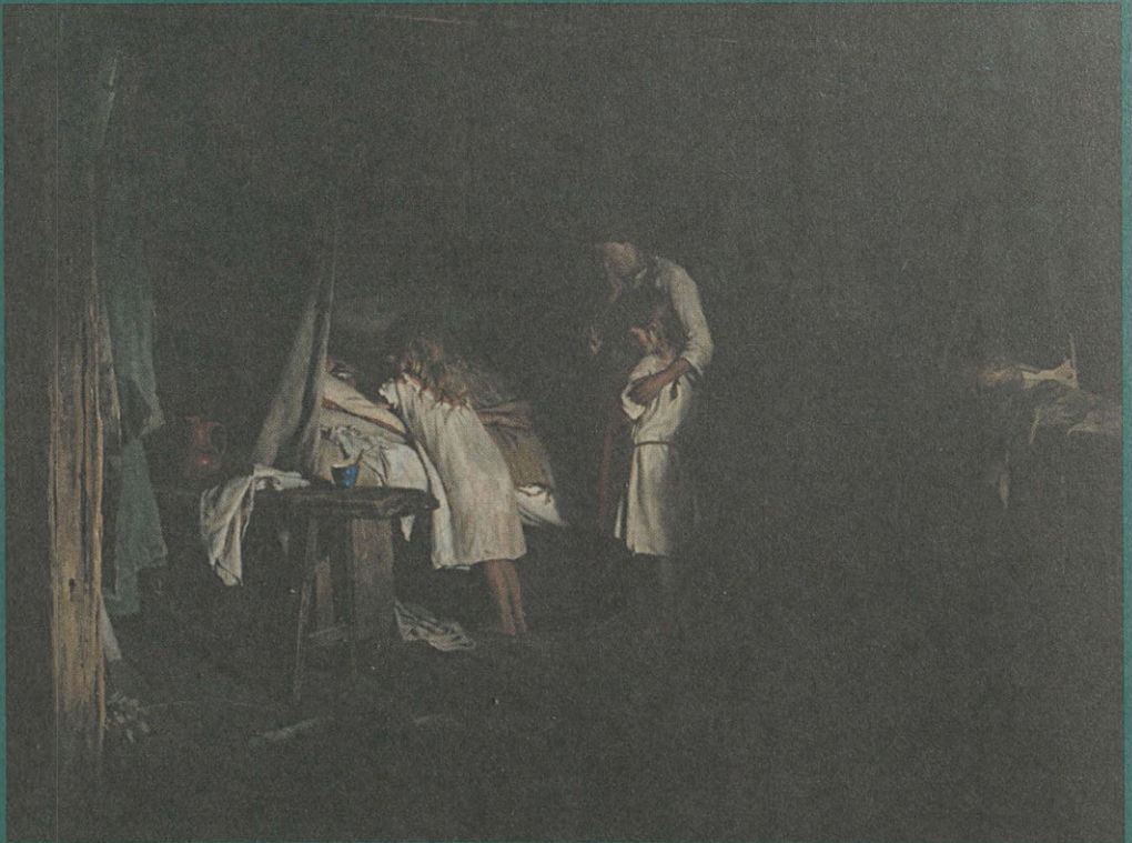
У постели умирающей крестьянки. 1886 г. К. В. Лемох