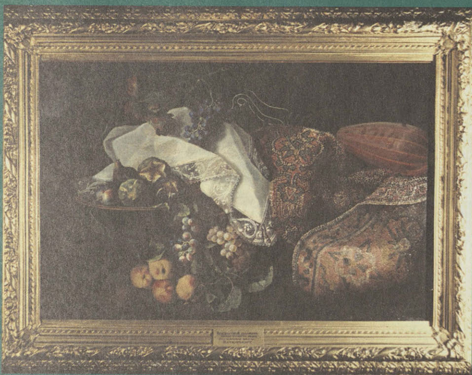
Нагюрморт. 1714 г. Италия. Неизвестный художник