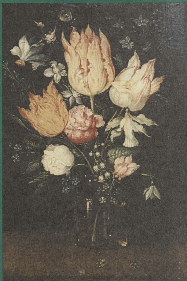
Цветы в стакане. XVI—XVII вв. Фландрия. Круг Брейгеля