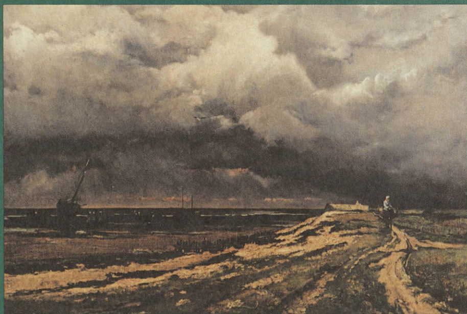
Берег моря. Начало XIX в. Франция. Неизвестный художник