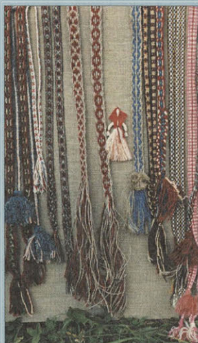
Льняные пояса. Работа выполнена детьми — участниками фольклорного клуба, созданного при музее