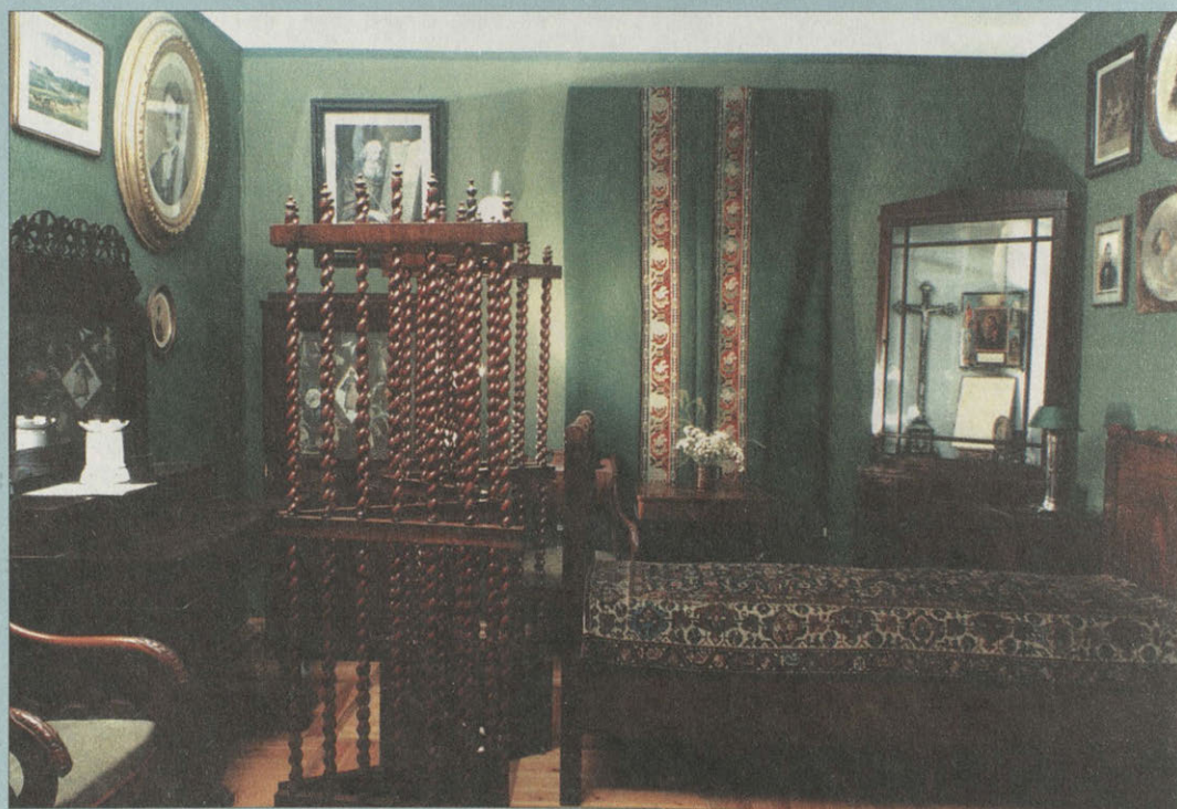
Обстановка спальни Ф.И. Тютчева