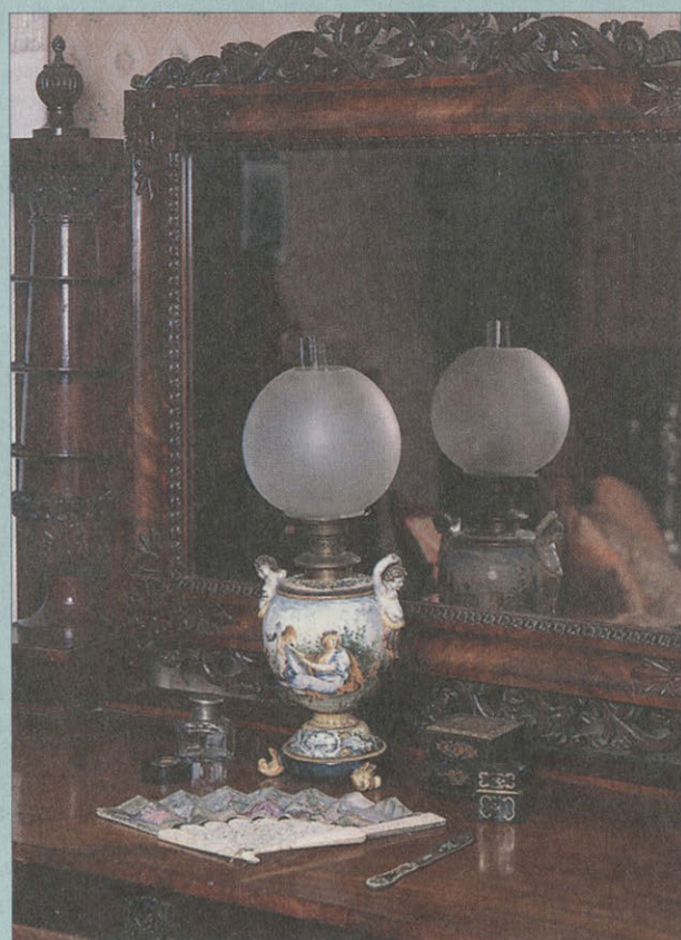
Спальня О.Н. Тютчевой. Туалетный столик