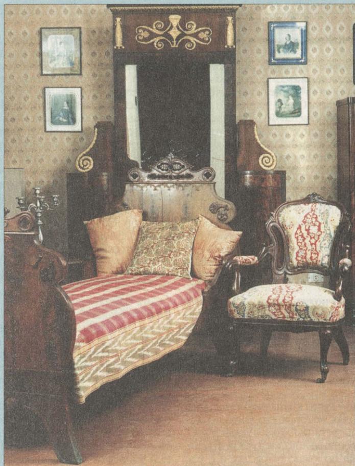
Спальня О.Н. Тютчевой. Уголок с кушеткой