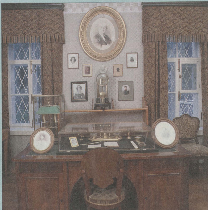
«Кабинет двух поэтов». Стол Ф.И. Тютчева