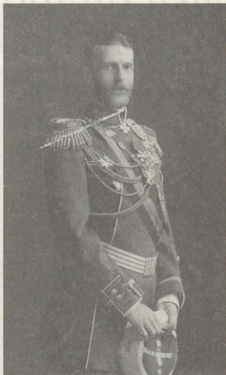
Великий князь Сергей Александрович. Кон. XIX – нач. XX в. Фотография со следами порезов от разбитого стекла

На фотографии Елизаветы Федоровны надпись: «Елисавета. В память нашей совместной работы 1904/5». Семья Тютчевых была близка к император-