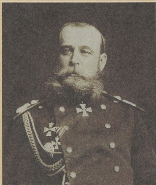
М.Д. Скобелев. Фото. <1870-е гг.> Эта фотография генералом Скобелевым подарена И.С. Аксакову