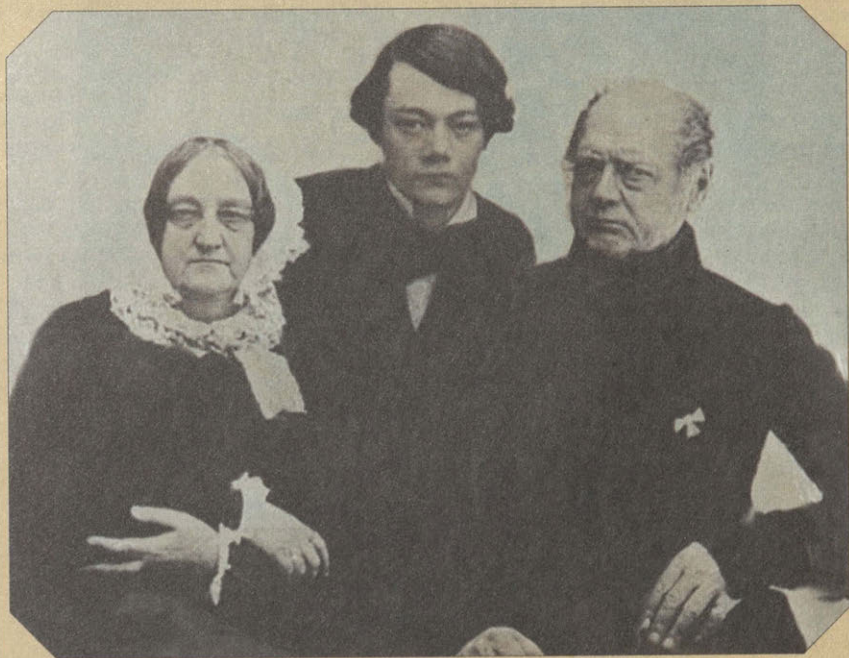
Т.Л., Ф.И. и В.Ф. Миллеры. Дагерротип. 1850-е гг. Принадлежал Ф.И. Тютчеву