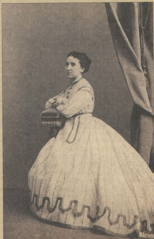
Портрет О.Н. Тютчевой Фотография. 1868.