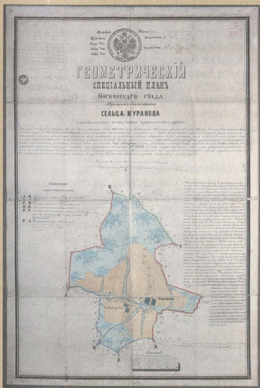
План сельца Муранова

Купчая на усадьбу в селце Муранове 1815 года 19