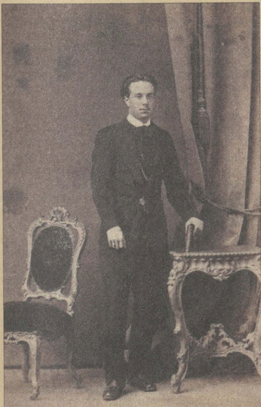
Портрет И.Ф. Тютчева Фотография. 1868.