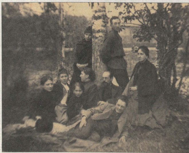
Семья Тютчевых-младших и их гости на острове Мурановского пруда. 1890-е гг.

Хочется надеяться, что мурановская родословная еще долго будет возбуждать любовь молодых поколений, навеивая воспоминания о розовых лепестках цветущих персиков, о некогда столь живом и разнообразном, столь возвышенно-прекрасном усадебном мире.