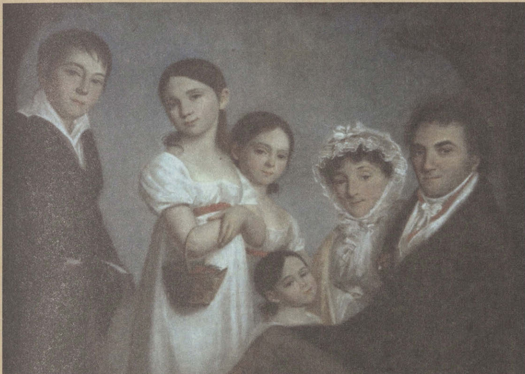
К. Барду. Семейство Энгельгардтов. 1816. Пастель