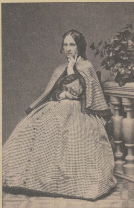
С.Л. Пуляга Фотография 1860-х гг.