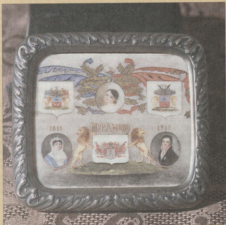
М.Н. Градовская. Миниатюра к 100-летию усадьбы Мураново