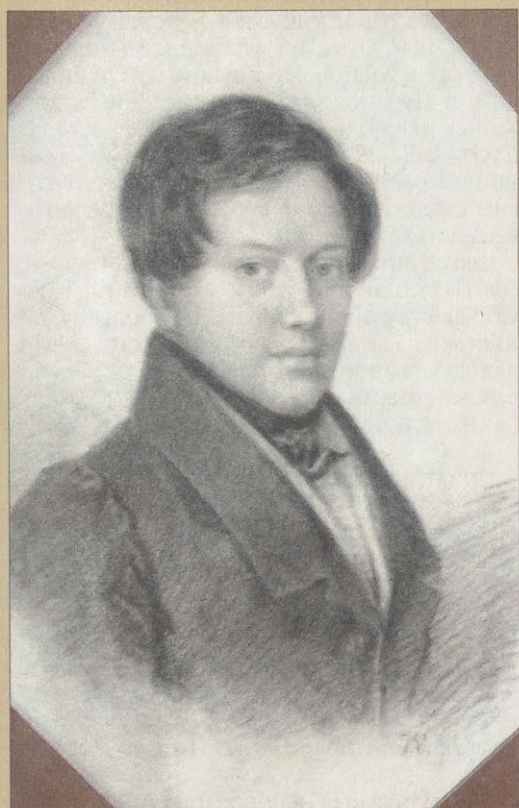
Е.А. Боратынский Фотография с рис. Ж. Вивьена. 1826