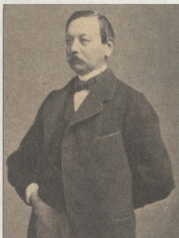
Портрет Д.В. Путяты Фотография 1860-х гг.

Что мы знаем об этом художнике? Родился он в семье кригс-генерала Василия Ивановича Путяты в 1806 году 26 октября по ста-