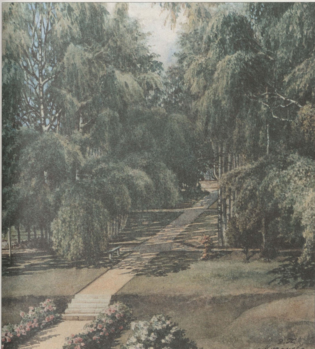
Д.В. Путьята Часть сада с аллеей роз. 1869. Бумага, акварель

осиротевший дом, и его поселяют в комнате умершего брата. Он работает над двумя акварелями: видом дома с южной стороны с зимним садом и видом палисадника перед домом. Одну из этих акварелей он уже в Петербурге заключил в рамку и прислал в подарок «дорогому племяннику». Скорее всего, это был южный фасад главного усадебного дома.