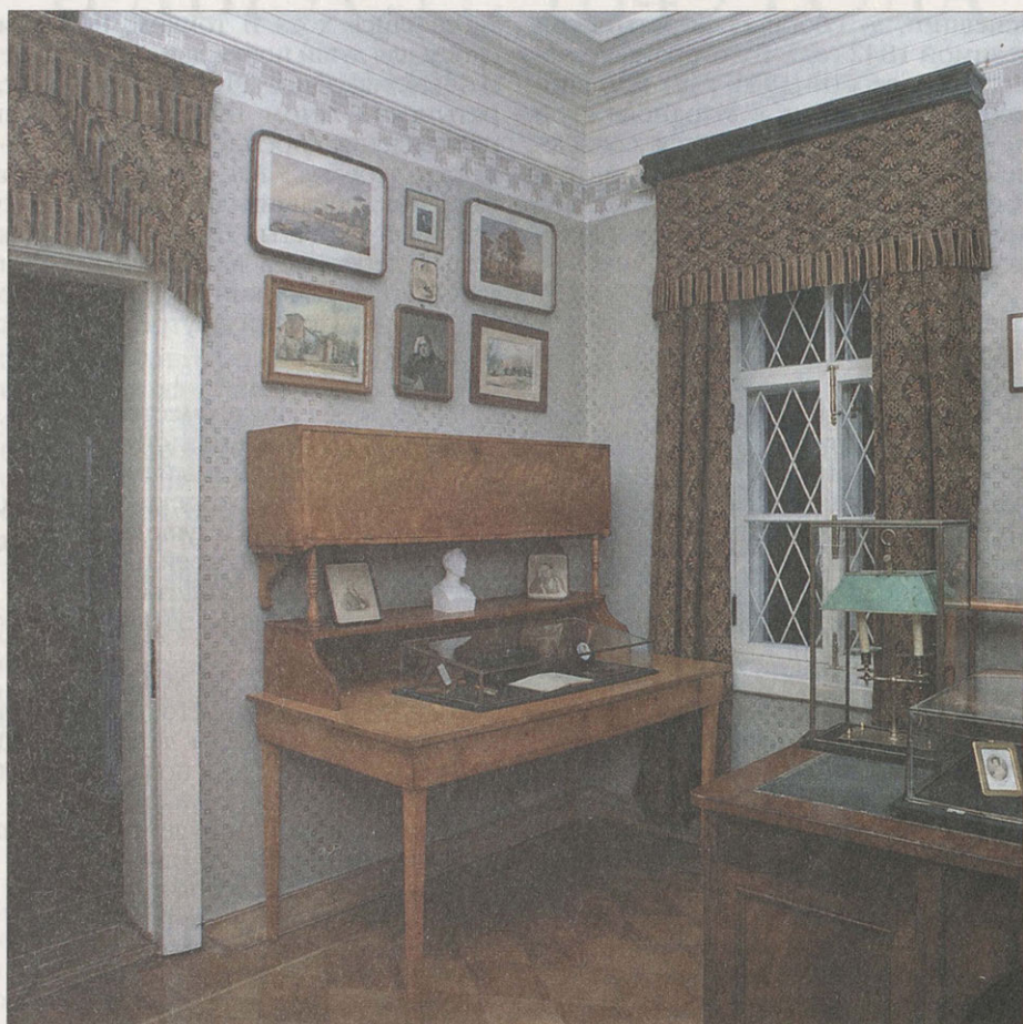
«Кабинет двух поэтов». Письменный стол Е.А. Боратынского

дом в строительной практике — свободным расположением комнат. Каждая из них предполагает изолированность от соседних и при необходимости может служить местом уединения. Одновременно и жилые, и парадные комнаты сходятся в Большой гостиной, где семья поэта собиралась по вечерам.