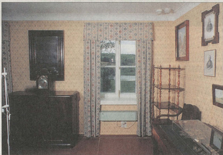
Уголок Гоголевской комнаты

29 августа в обстоятельном письме сыну Ивану Сергей Тимофеевич писал: «Я в жизнь мою не помню такого гнусного времени как теперь: или дождь с холодом и ветром, или мороз». Но погода не помешала ему с сыном в скором времени после отъезда Гоголя отдать визит новому соседу. «На днях мы были с Костинькой у Путяты: он сам кажется порядочный человек, и его сестра и жена — неглупые женщины». Так началась дружба обитателей этих усадеб.