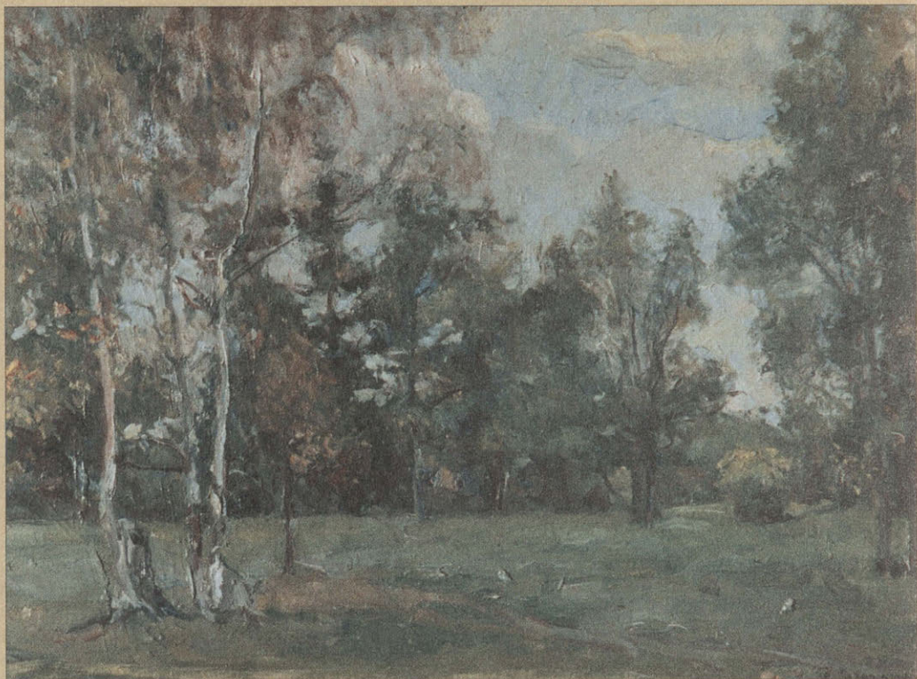
Н.С. Козочкин. Летний день. 1941. Картон, масло