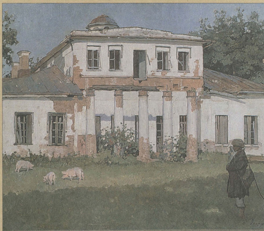
О.Ю. Клевер. Зброшенная усадьба. (Дом в Овстуге). 1912. Холст, масло