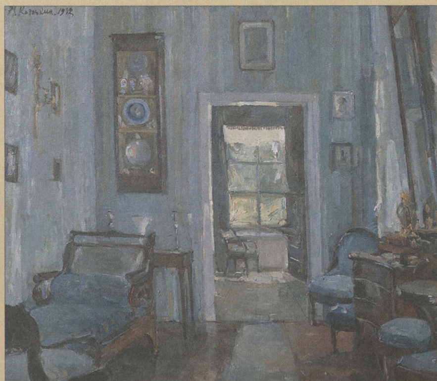
Н.С. Козочкин. Голубая гостиная. 1942. Холст, масло