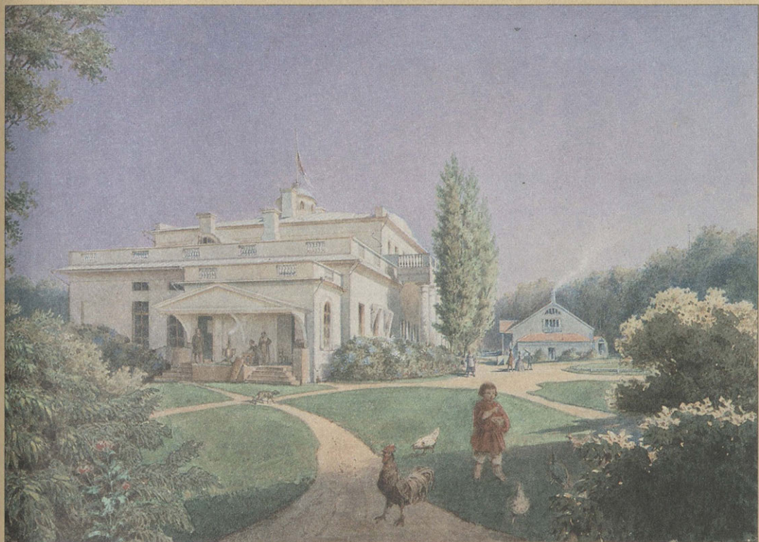
О.А. Петерсон. Дом в Овстуге. <1860 – нач. 1870-х гг.> Бумага, акварель