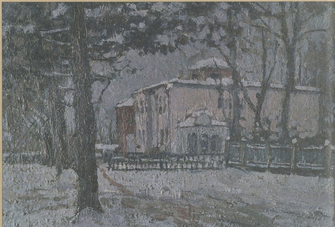
П.И. Петровичев. Мурановский дом зимой. Этюд. Не позднее 1935 г. Картон, масло. Публикуется впервые