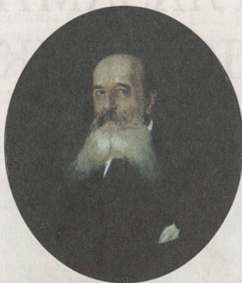
П.Д. Шмаров. Портрет И.Ф. Тютчева. 1909. Холст, масло

К 100-летию усадьбы художница М.Н. Градовская выполнила две миниатюры — композиции из дворянских гербов и портретов мурановских обитателей. Интересная работа этой художницы сохраняется в главном доме — абажур настольной лампы, ук-