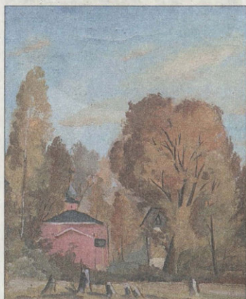
А.И. Кравченко Красная Кerkovь <1924–1925> Холст, масло

Музей-усадьба Мураново известен преимущественно как литературно-мемориальный. Тема жизни и творчества двух поэтов — Е.А. Боратынского и Ф.И. Тютчева — настолько доминировала над остальным его содержанием. Между тем «мурановский феномен» — универсальное многозначное явление, требующее всестороннего осмысления. Одна из важнейших его составляющих — художественный аспект усадебной жизни (наличие в доме предметов искусства, создание эстетической среды, присущей именно усадебному миру, художественное воспитание детей, отношение к событиям художественной жизни).