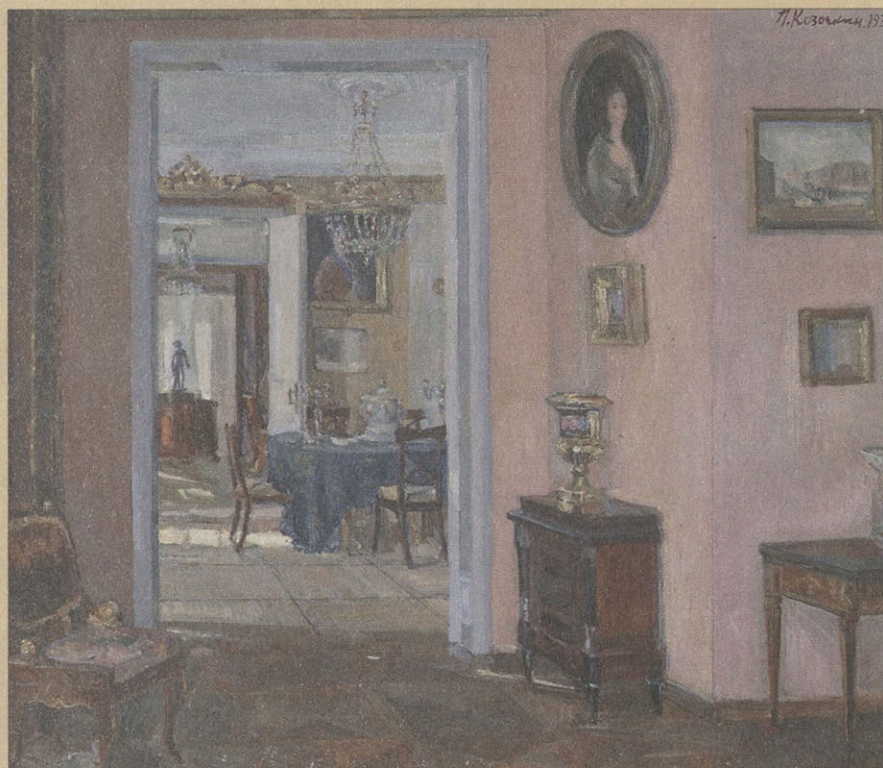
Н.С. Козочкин. Анфилада в мурановском доме. 1939. Холст, масло