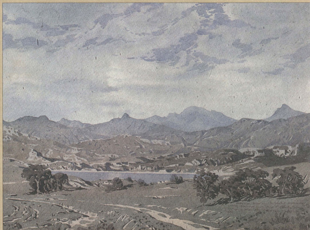
М.А. Волошин. Крымский пейзаж. 1923. Бумага, акварель