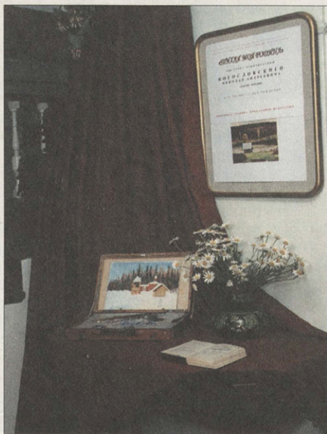
Интерьер художественной выставки работ Н.А. Богословского. 2002

Живописные полотна и графические вещи, созданные в Муранове, умножают славу этого притягательного историко-культурного уголка России, а в ряде случаев становятся драгоценными страницами его художественной летописи.