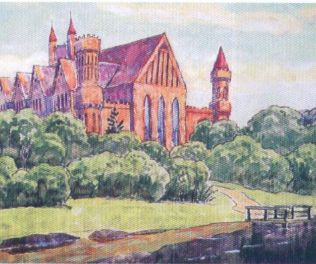
Замок в Буженинове

проходила в Белоруссии. Демобилизовавшись в 1950 году он снова поступил в Ярославское художественное училище. Окончил его в 1955 году и был направлен на работу учителем рисования и черчения в Челябинскую область, на Урал. В 1959 году он переехал в Гомель, где когда-то служил в армии, и поступил на работу в художественно-производственные мастерские Худфонда БССР. Участвовал во многих областных и некоторых республиканских выставках Белоруссии.