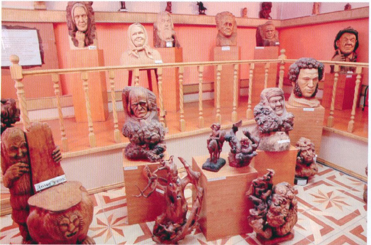
Коллекция работ В.В. Майданюка украшает Музей краеведения и леса в Пречистом