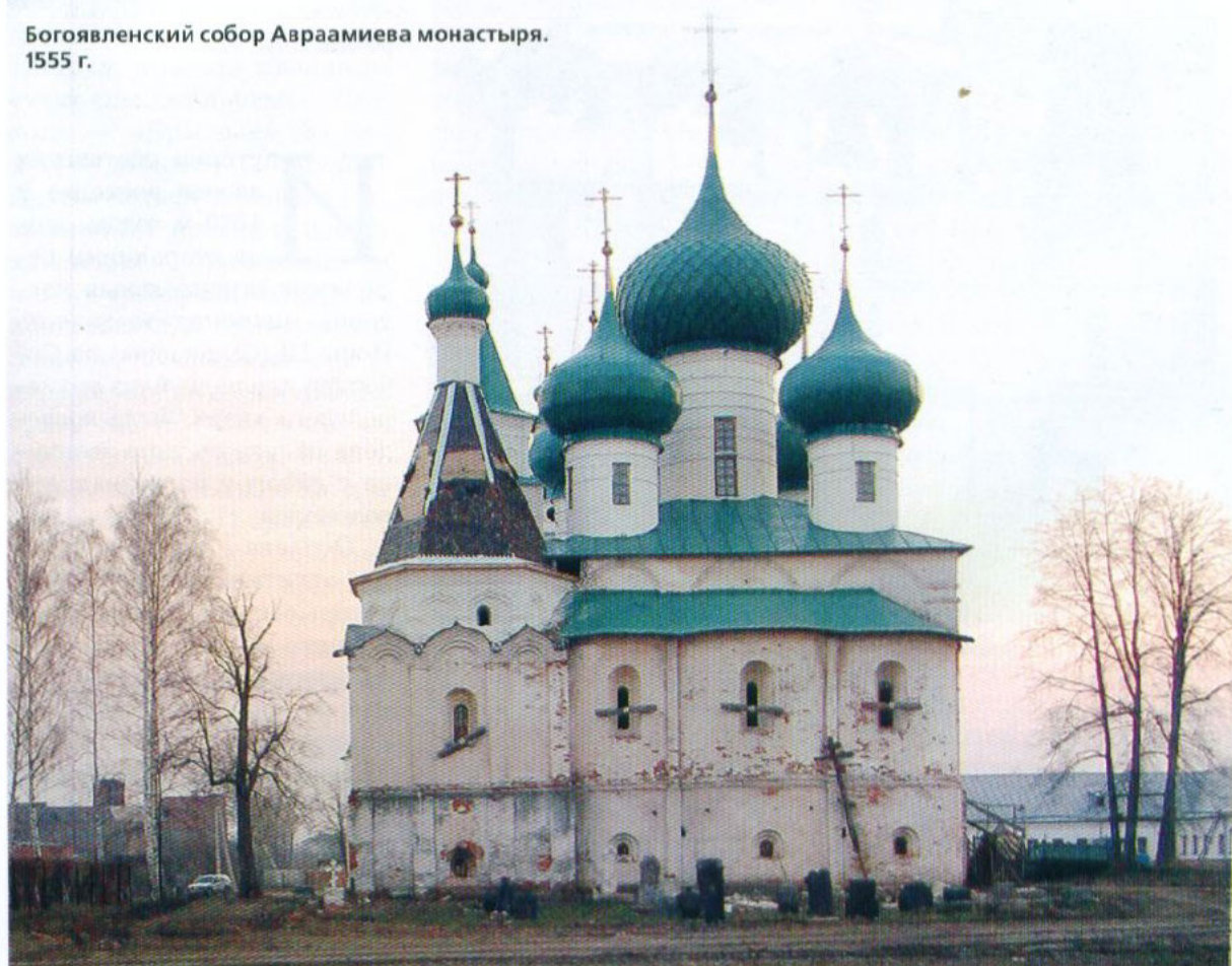
Богоявленский собор Авраамиева монастыря. 1555 г.

На месте явления Авраамию Иоанна Богослова в 1687 году была построена деревянная церковь Иоанна Богослова на Ишне. Перед взятием Казани Иван Грозный взял жезл, которым преподобный сокрушил идола, надеясь с его помощью победить татар.