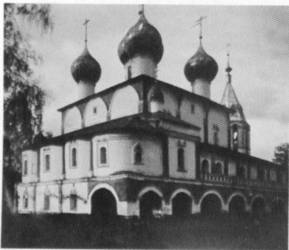
Церковь Богоявления «на Острову» в Хопылеве. 1701 г. Фото нач. XX в.

Школьный музей стал для поселка Ермаково и окрестных населенных пунктов настоящим центром воспитания любви к Родине. Центральное место в нем занимают экспозиции, посвященные истории флота и Ф.Ф.