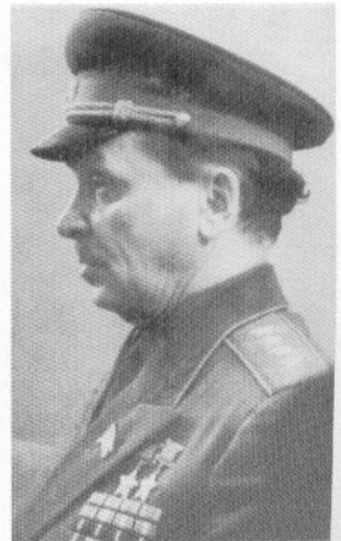
П.И. Батов.

Юношей Батов был призван в армию. За отвагу и мужество в боях Первой мировой войны был награжден