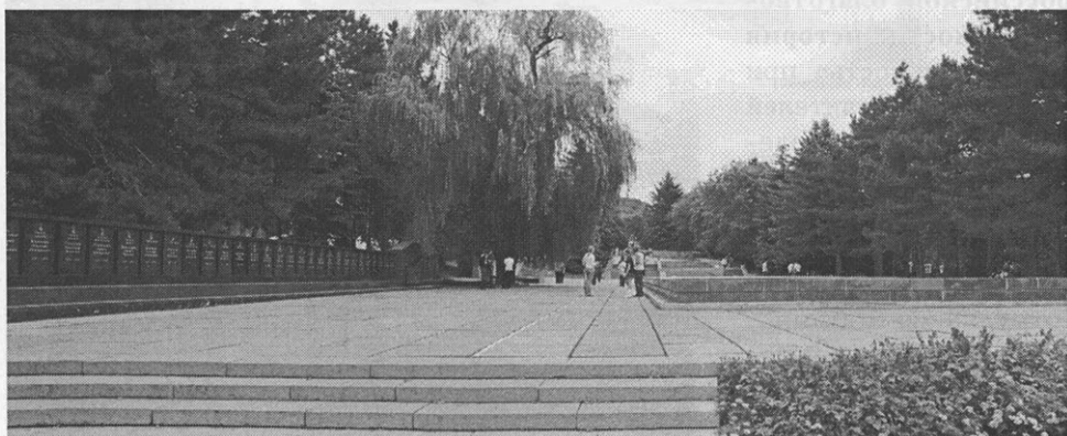
Пятигорск. Мемориал-памятник воинам, погибшим в годы Великой Отечественной войны