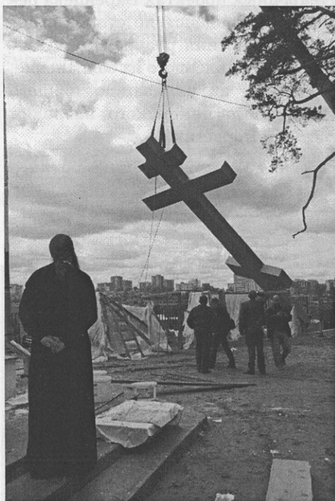
Воздвижение Царского креста у часовни Михаила Тверского. 2010 г.

Пермское краевое отделение Всероссийского общества охраны памятников истории и культуры совместно с администрацией Пермского края, Пермской епархией, администрацией города Перми и Пермской городской думой с 2006 года проводит мероприятия, объединенные под общим названием «Романовские дни в Пермском крае». Направления работы по увековечиванию памяти боярина Михаила Никитича Романова, родного дяди Михаила I, и великого князя Михаила Александровича, жизнь которых трагически закончилась на пермской земле, определены программой «Святой Михаил». В Романовские дни проходит тематическая научно-практическая конференция, крестный ход к часовне Михаила Тверского, небесного по-