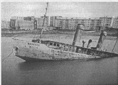
Ледокол «Ангара». 1988 г.

В 1963 году ледокол «Ангара» был передан ДОСААФ, судно перевели с Байкала на 21-й километр Иркутского водохранилища. В 1975 году ДОСААФ отказалось от использования ледокола, а ВСУРП списало его со своего баланса. Корабль фактически стал бесхозным. Начались скитания ледокола по зали-