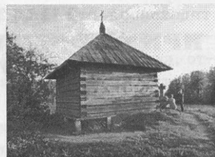
Заповедные пушкинские места. На Савкиной горке

Ясности с положением музеев-заповедников не внес и Феде-