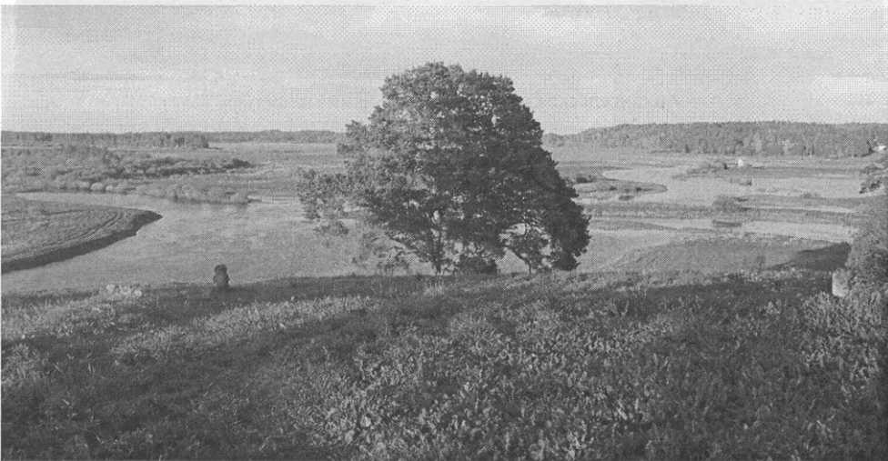
Музей-заповедник А.С. Пушкина «Михайловское». Вид с Савкиной горки.

Российские музеи-заповедники должны обеспечивать сохранность, восстановление, изучение и публичное представление целостных территориальных комплексов культурного и природного наследия, материальных и духовных ценностей в их традиционной исторической среде.