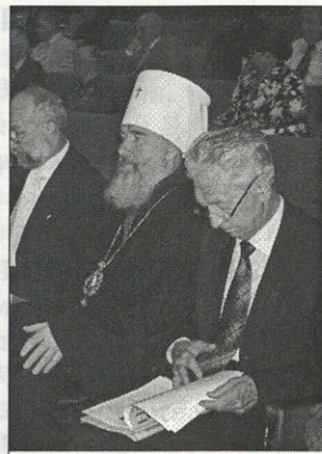
Юбилейный пленум, посвященный 40-летию ВООПИК, проводился в здании Администрации Президента Российской Федерации. Июнь 2006 г.