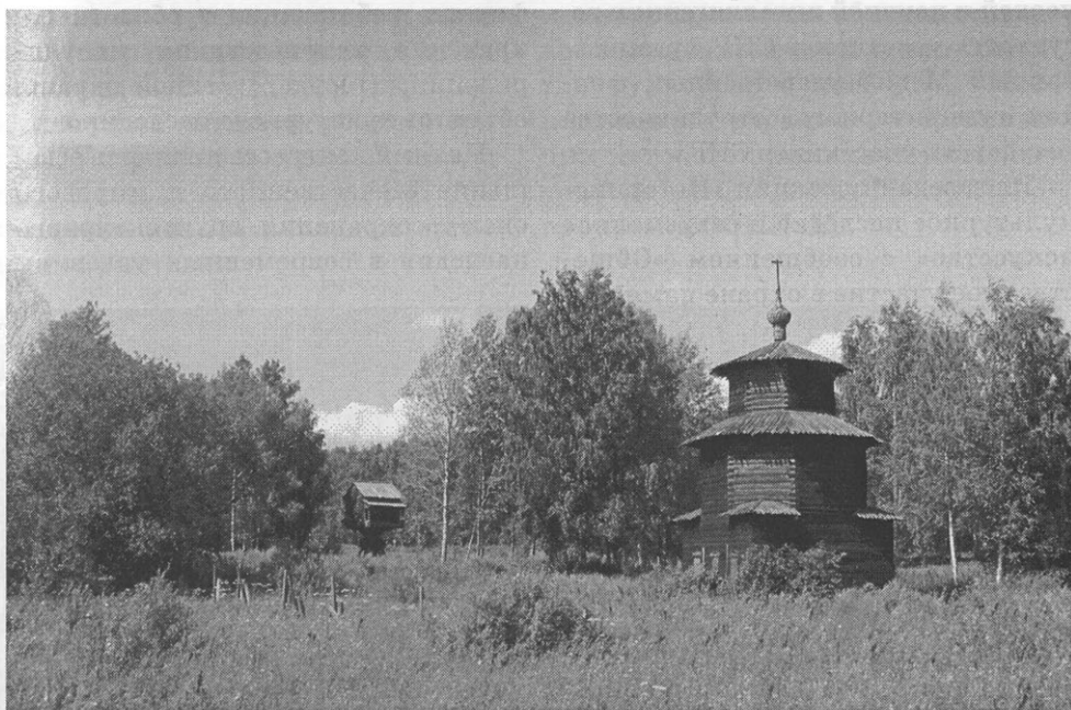
Музей деревянной архитектуры в Костроме

Участники форума высоко оценили роль совместной работы по возрождению культурных и нравственных традиций нации. Накопленный опыт комплексного, межве-