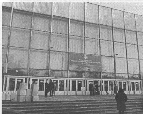
Павильон ВВЦ. Семинар на форуме «Сохранение культурного наследия». 2011 г.

В рамках форума прошел Международный конгресс «Современные тенденции охраны и реставрации объектов культурного наследия» , международная выставка «Индустрия реставрации, сохранения, охраны и популяризации культурного наследия», а также конкурс проектов в области восстановления и приспособления объектов культурного наследия «Московская реставрация», в организации которого принимали активное участие специалисты Центрального совета ВООПИиК.