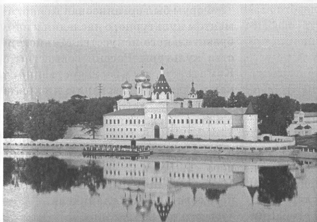
Ипатьевский монастырь — бывший архитектурный музей-заповедник в 2004 г. был изъят из ведения органов культуры и передан в ведение Костромской епархии Русской православной церкви