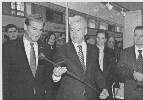
В работе Международного конгресса принял участие мэр Москвы С.С. Собянин

Целями конгресса являлось освещение отечественного и мирового опыта сохранения архитектурного наследия в современных условиях