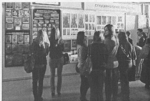
Стенд студенческих проектов реставрации