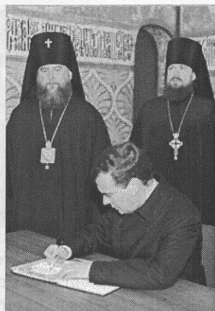
Посещение Ипатьевского монастыря Президентом России Д.А. Медведевым. 15 мая 2008 г.

лидации усилий в указанном направлении свидетельствует широкое представительство на мероприятии законодательных и исполнительных органов государственной власти субъектов Российской Федерации, общественных и религиоз-