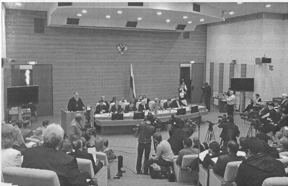
Парламентские слушания «О передаче религиозным организациям имущества религиозного назначения, находящегося в государственной или муниципальной собственности». 15 сентября 2010 г.

По итогам слушаний были приняты рекомендации по законопроекту «О внесении изменений в Федеральный закон №73 «Об объектах культурного наследия (памятниках истории и культуры) народов Российской Федерации», многие из этих предложений были учтены Комитетом по культуре Государственной Думы.