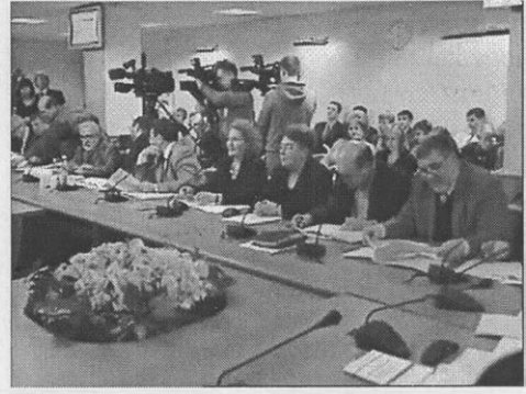
Парламентские слушания «Правовые аспекты реставрации объектов культурного наследия (памятников истории и культуры) народов Российской Федерации». 21 марта 2011 г.