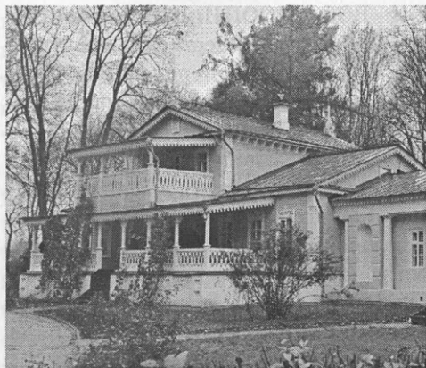
Орловская область. Государственный музей-заповедник И.С. Тургенева «Спасское-Лутовиново»

Для преодоления сложившейся ситуации необходимо ускорить принятие закона о внесении изменений в Федеральные законы «О Музейном фонде Российской Федерации и музеях Российской Федерации» и «Об объектах культурного наследия (памятниках истории и культуры) народов Российской Федерации», в части определения музея-заповедника и его видов деятельности, включая меры обеспечения сохранности объектов культурного наследия, их территорий и зон охраны, а также расширить права общественных организаций в сфере охраны