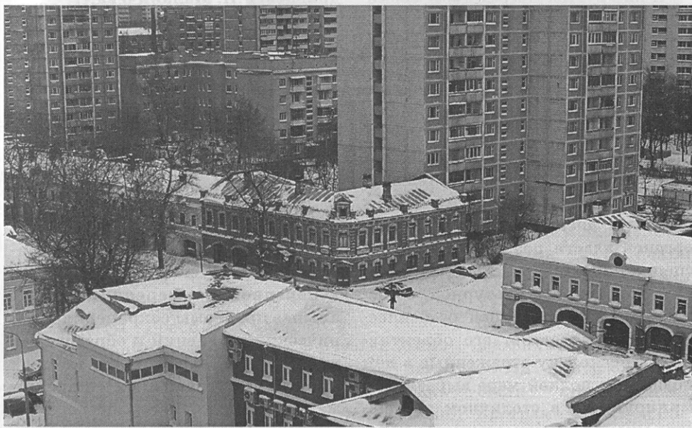
Школьная улица в Москве – сохраненный уголок ансамбля Рогожской слободы. Здесь располагаются Центральные научно-реставрационные проектные мастерские.