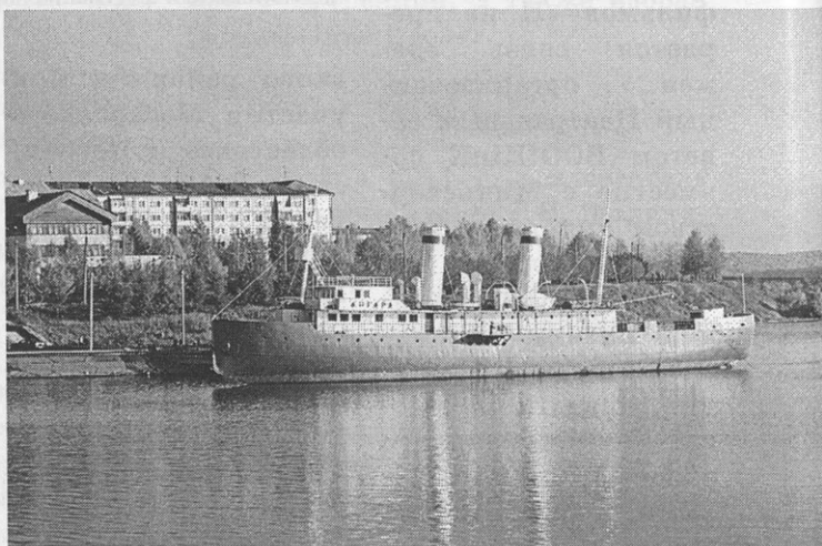
Ледокол «Ангара» стал общественным музеем Иркутска