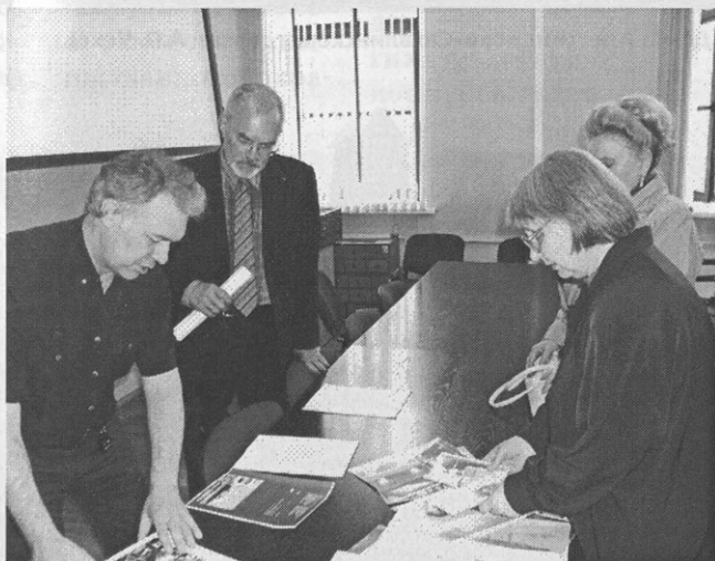
Обсуждение макета комплекта открыток о ледоколе «Ангара» в Иркутском областном отделении ВООПИиК

Внимание читателей привлекается к актуальной не только для Иркутска, но и многих крупных городов России теме: как, выполняя программу «Доступное жилье», строить так, чтобы сохранить для будущих поколений исторический центр. Повод к этому дает и «Программа сноса ветхого жилья в Иркутске», и так называемая «точечная застройка».