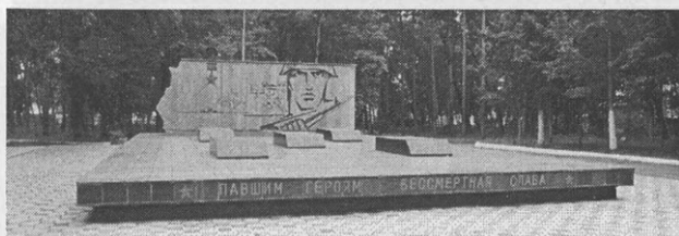
Дальнереченск. Мемориальное кладбище офицеров-пограничников, погибших на острове Даманский в 1969 г.

ванию памяти пограничников, погибших на острове Даманский. Материалы газеты способствуют военно-патриотическому воспитанию молодежи.