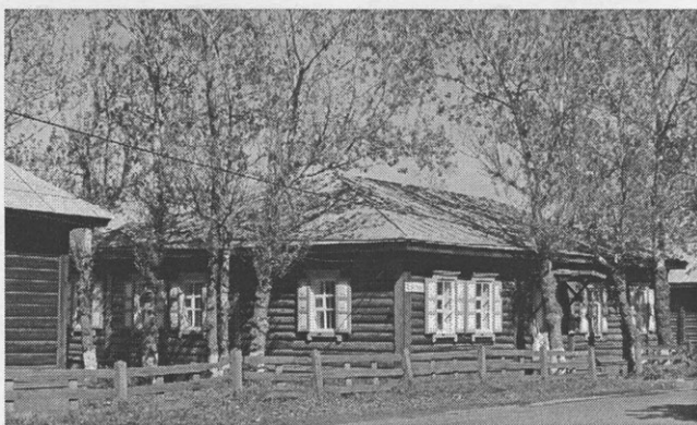
Дом в Александрове-Сахалинском, где жил А.П. Чехов

Газета поднимает проблему работы местных музеев. На островах 15 муниципальных музеев, в которых более 140 тысяч единиц постоянного хранения. Но беда в том, что катастрофически не хватает помещений, музейных залов, а потому значительная часть интереснейших экспонатов скрыта от посетителей в запасниках.