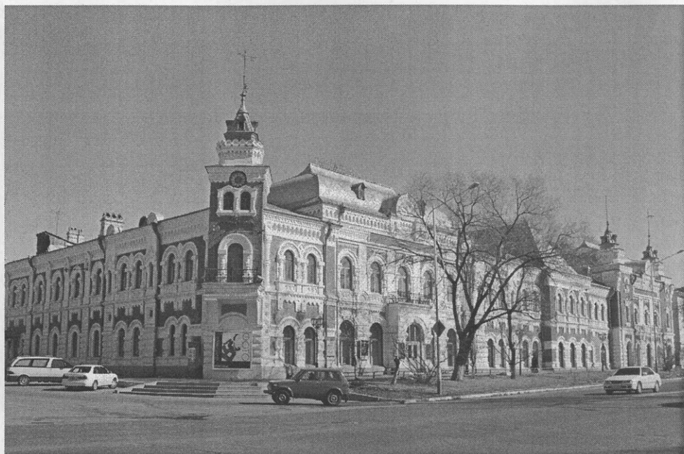
Благовещенск. Здание Торгового дома «Кунст и Альбертс» (ныне — Краеведческий музей)