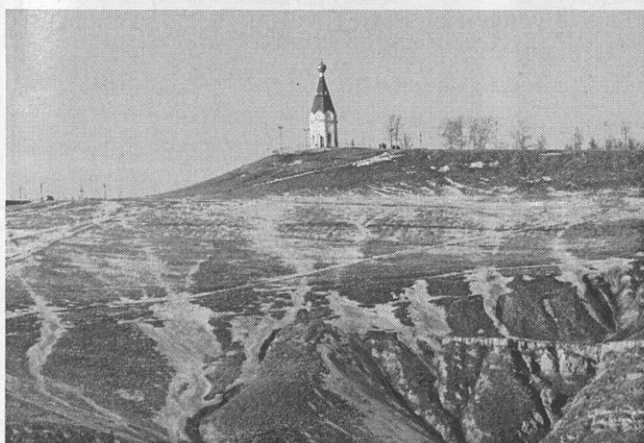
Красноярск. Караульная башня-часовня на Красном Яре

рая активно обращается к молодежной тематике. Так, публикация И. Даниленко «Стыдно забыть» посвящена походу молодежи из разных объединений Норильска к мемориалу «Новая Голгофа» в рамках акции «Сохраним памятники». Жюри отметило большой вклад газеты в дело привлечения молодого поколения к проблемам сохранения историко-культурного наследия, окружающей среды, восстановлению и поддержанию мемориальных комплексов, воспитанию патриотизма.