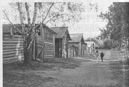
Музей деревянного зодчества «Тальцы» под Иркутском