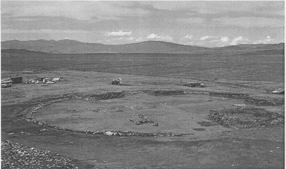
Республика Тыва. Раскопки кургана в Долине Царей

Тема сохранения историко-культурного и природного наследия — одна из основных в представленных материалах. Многие статьи заставляют местные органы власти пересмотреть отношение к охране памятников, учитывать мнение специалистов, общественности и принимать необходимые меры. К сожалению, подведение итогов конкурса в 2009 году не состоялось в связи с неблагоприятной экономической ситуацией.