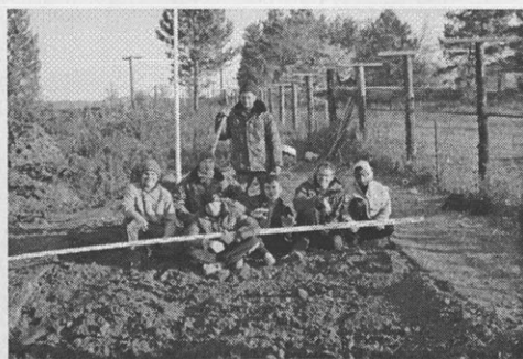
Амурская область. Археологический отряд на месте Албазинской крепости