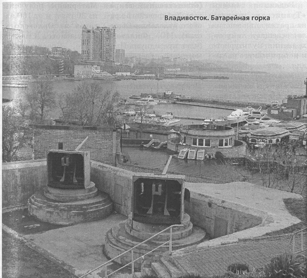
Владивосток. Батарейная горка