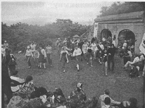
Мероприятие ВООПИиК на острове Русский