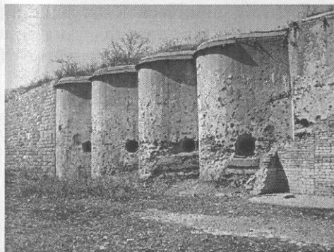
Один из фортвов Владивостокской крепости