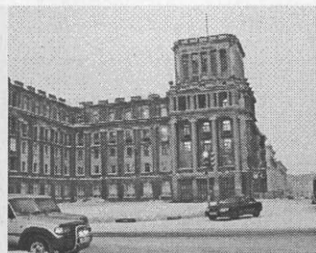
Комплекс застройки центра Норильска. 2007 г.