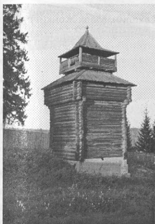
Иркутская область. Башня Бельского острога