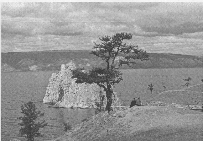
Байкал. На острове Ольхон

Жюри единогласно присудило первую премию газете «Восточно-Сибирская правда». В центре внимания газеты — тема защиты озера Байкал. Ведь невозможно сохранить культурное наследие, минуя экологические проблемы. Проблемным статьям, посвященным государственной экологиче-