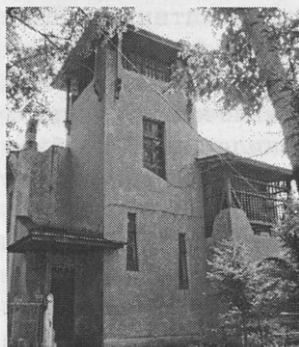
Бывший Алексеевск (ныне Свободный). Дом начальника строительства Амурской железной дороги

Познавательна газета «Зейские огни», выходящая в городе Свободном Амурской области. Она отличается разнообразием тем, рубрик. Особенно интересна рубрика «История: факты, документы, традиции». В одном из таких материалов мы узнаем об исто-