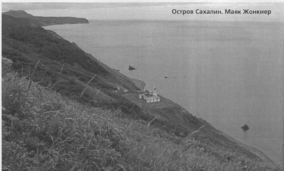
Остров Сахалин. Маяк Жонкиер

Краеведение — одна из значащих тем газеты «Советский Сахалин». Газета ведет рубрику «По Чеховским местам с томиком писателя». В поле зрения газеты — декоративно-прикладное искусство коренных народов, проблема преемственности традиций мастеров народных промыслов.