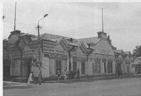
Амурская область. Здание Торгового дома «Чурин и К°» в городе Зeya

Газета «Победа» (Приморский край) представила подборку по социально-культурным проблемам коренных народов Сибири и Дальнего Востока, а также — по увековечи-