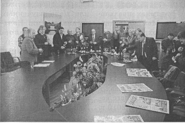
Прием актива Московского областного отделения ВООПИиК в Министерстве культуры Московской области. 2010 г.